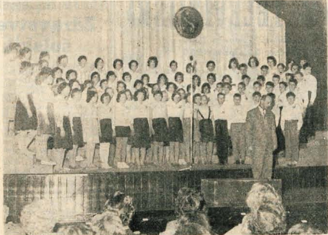
Mladinski pevski zbor Javornik-Koroška Bela

Dragi urednik! Pred dnevi sem v kranjskem kinu gledal ameriško filmsko delo »Mestece Payton«.