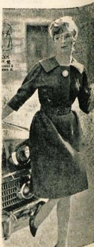
Preprosta, a elegantna obleka primerna za spomladanske dni