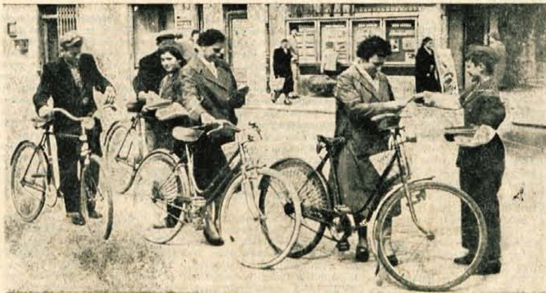
Pionir-prometnik je zaustavil skupino kolesarjev in jim izročal letake

Sindikalna organizacija v tovarni se že pripravlja na volitve in pripravila predloge za kandidate. V nov delavski svet bodo izvolili 85 članov. Se pred volitvami bo dosedanji delavski svet potrdil zaključni račun za preteklo leto. Predvideno je, da bo o njem razpravljal na seji v ponedeljek, 18. aprila. — Spričo uspehov, ki jih je kolektiv »Iskra« dosegel v zadnjih letih, delavski svet ne bo imel težke naloge. Proizvodnja je v stalnem porastu prav tako pa narašča tudi produktivnost. V primerjavi z letom 1949 so proizvodnjo lani podesetorili. Proizvedli so za 31 odstotkov več blaga kot leta 1958. Produktivnost so povečali za 25 odstot-