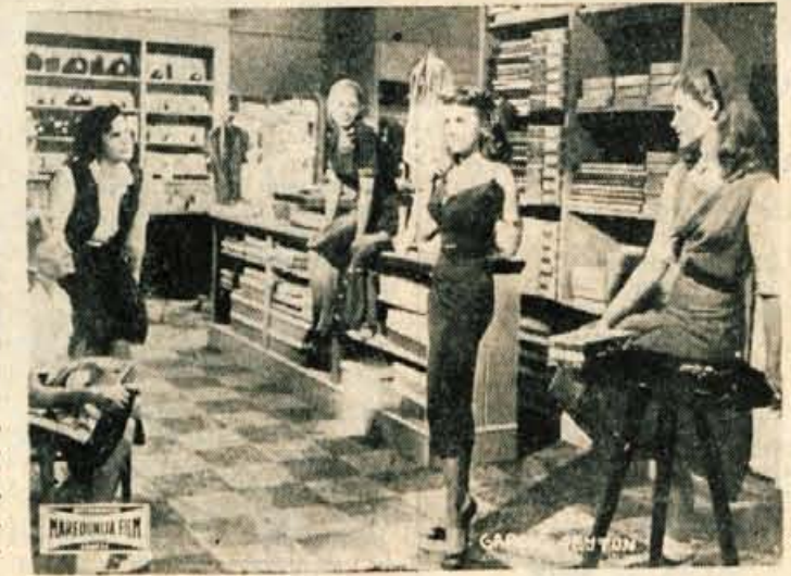
Prizor iz ameriškega filma »Mestece Payton«