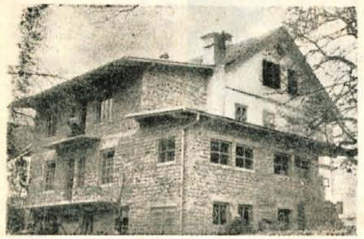
Preskrba z mlekom je na Gorenjskem že več let precej problematična. Povsod jo skušajo na neki način urediti in izboljšati. Tudi v Škofji Loki so adaptirali in razširili poslopje, v katerem je mlekarja.

Odbor pripravlja za vse udeležence poučno ekscurzijo po Gorenjski in sicer v smeri Kranj, Golnik, Trzin, Begunje, Draga, Bled, Bohinj in nazaj na Škofjo Loko. M. C.