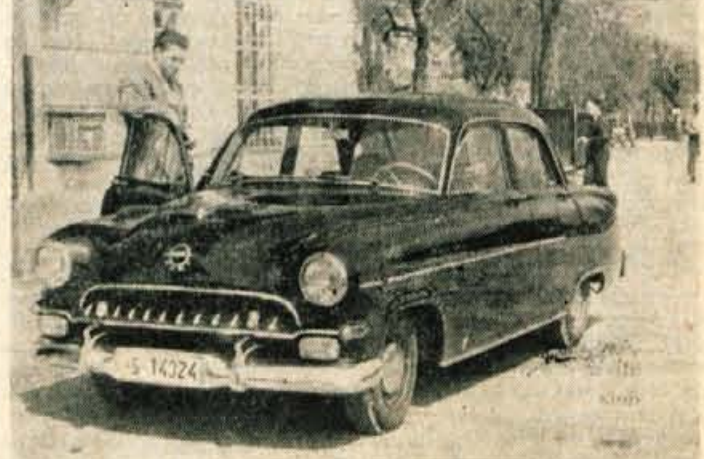
Od Parkhotela do železniške postaje Bled-jezero: 600 dinarjev

»Tudi zunanje okolje pri gostinskih objektih naj kaže vi-