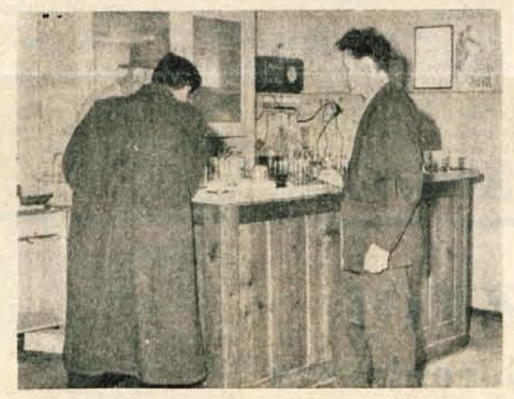
Tak je »Hotel Union« od znotraj — tipična gostilniška soba — (zgoraj) in tak ponosen napis vidimo zunaj (desno)