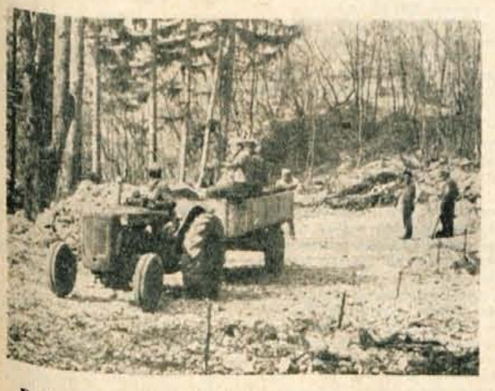
Do 1. maja bo dograjena nova avtomobilska cesta na Blejski grad. Dela so v teh dneh v polnem teku