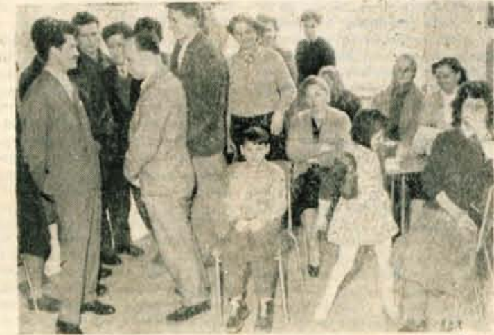
Gneča v splošnih ambulantah je iz dneva v dan večja

Mogoče bi se dalo vzpostaviti red z ureditvijo, podobno ureditvam v zobnih ambulantah. S tem bi odpadlo neupravičeno vednevo čakanje, odpadla bi