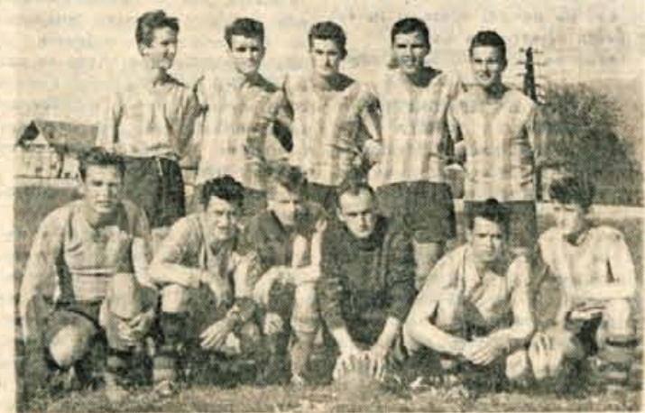
Nogometno moštvo »Partizana« iz Nakla

Sportno in telesnovzgojno delovanje v Naklem pri Kranju ima že dolgo tradicijo. Društvo Partizan bo namreč letos praznovalo 30-letnico ustanovitve prvega telovadnega društva v Naklem in 25-letnico ustanovitve športnega društva »Slovan«.