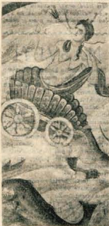
Gračanica: Poslednja sodba — 1321

Kranj, 11. marca — Danes je bila v Mestnem muzeju v Kranju otvoritev dveh nadvse vzgojnih razstav, in sicer v spodnjih prostorih razstava srbskih in makedonskih fresk, v zgornjih pa razstava »Mojstri risbe«. Na prvi razstavi je 30 reprodukcij fresk, ki jih je izdelal UNESCO. Freske izhajajo iz XI. do XV. stoletja, in sicer iz Nerezov, Milješeva, Sv. Sofije, Sopočanov, Prizrena, Studenice, Gračanice, Dečanov, Kalemija in Manasija. Čeprav so vse freske nastale v srednjem veku (izhajajo iz bizantinskega kroga), so bile odkrite šele po osvoboditvi. V svetu pa je zaradi njenih vrednot veliko zanimanje, zato ni čudno, če so te reprodukcije izšle v izdaji UNESCO.