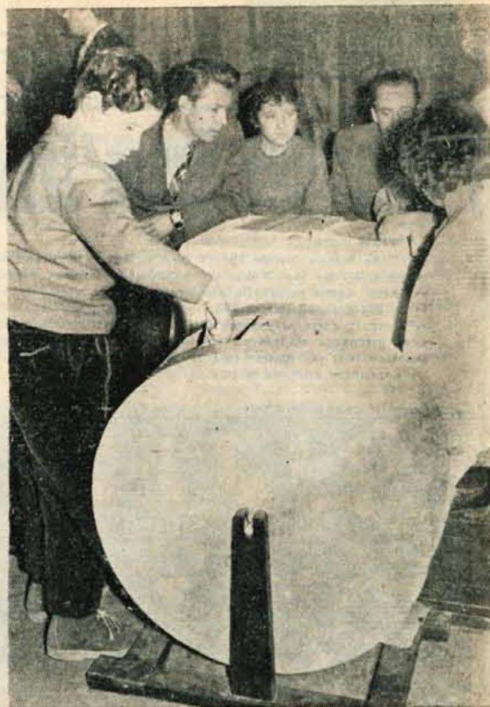
V sredo, 9. marca, je bilo na Jesenicah žrebanje naročnikov »Glasu Gorenjske«. Poročilo berite na 3. strani.