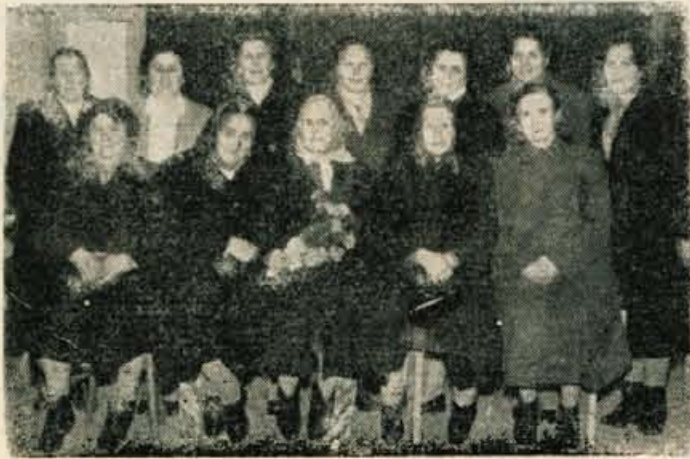
Preživele matere in žene padlih borcev NOB iz Voklega

Voklo Organizacija Zveze borcev Voklo-Voglje in Pionirski odred Osnovne šole Voklo sta v nedeljo, 6. marca v prosvetnem domu pripravila akademijo v počastitev Dneva žena. Pionirji, od najmlajših do najstarejših, so pripravili zelo pester kulturni spored. Ob koncu so bili deležni velikega priznanja občinstva. Organizacija ZB je povabila na proslavo tudi vse matere in žene padlih borcev NOV in jih po končanem sporedu pogostila.