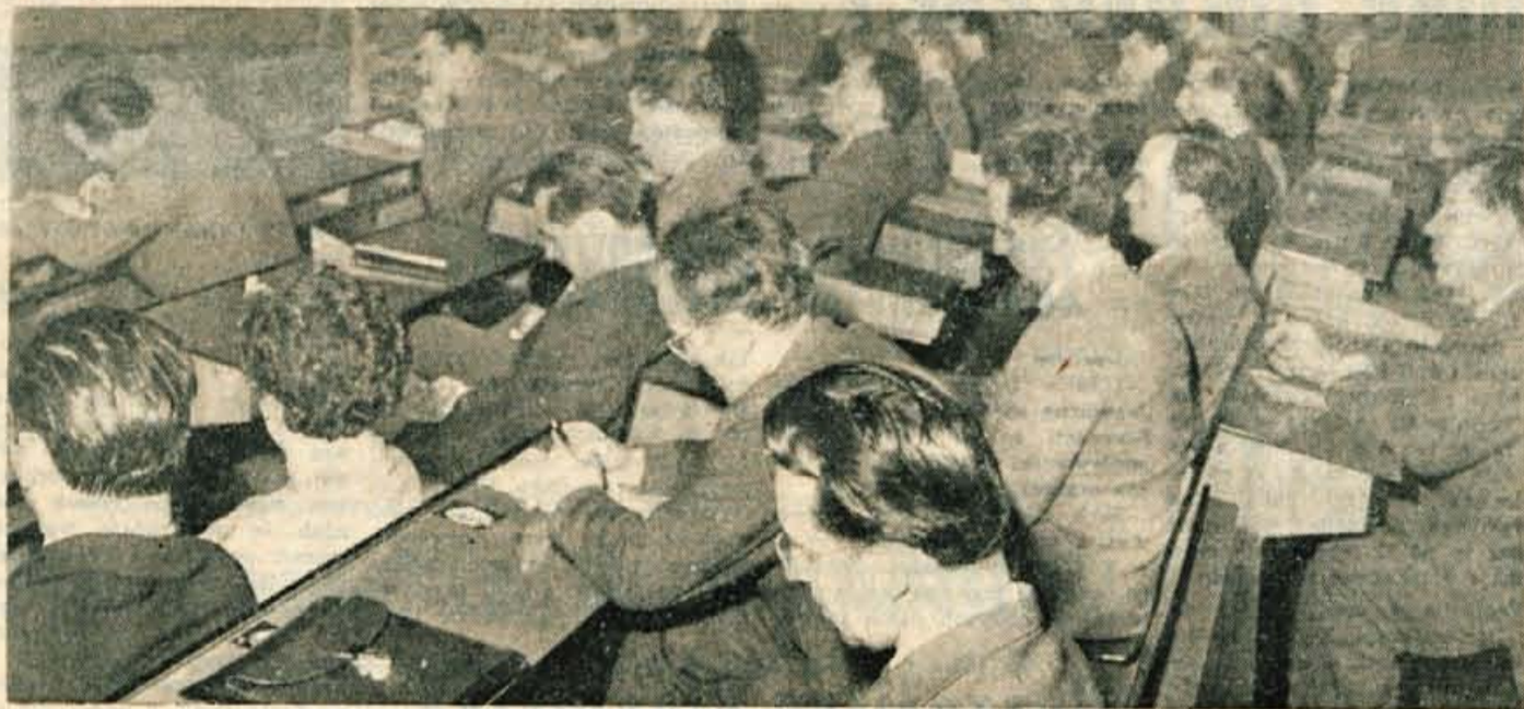
Delegati plenuma Okrajnega sindikalnega sveta med zasedanjem