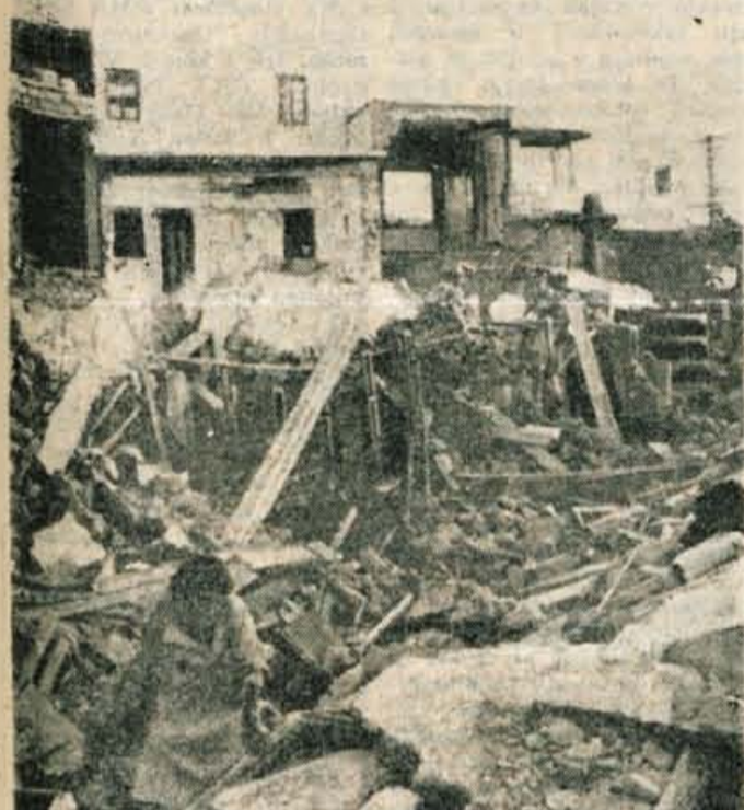
O potresu, ki je bil pred dnevi v maroškem mestu Agadirju, smo že pisali. Danes pa imamo na sliki priložnost videti ruševine, ki jih je s svojo močjo v tem mestu ustvarila narava.