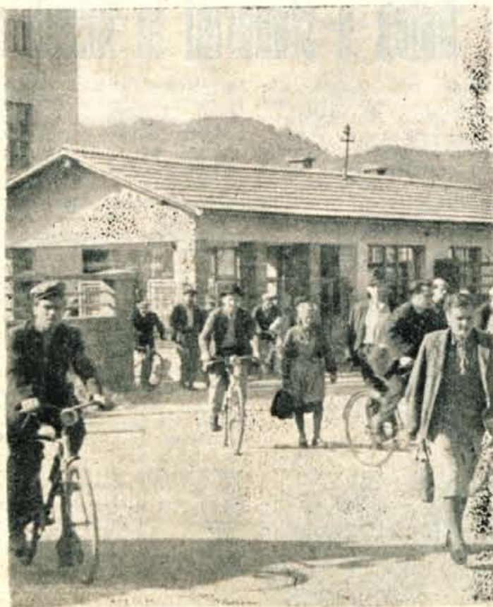
IZMENA — ob 14. uri prod »Alpino« Žiri

Izdaja CP »Gorenjski tisk« — Ureja uredniški odbor — Direktor 6. Beznik — Odgovorni urednik Vojko Vovak — Tel. uredništva 475 — Uprava 397 — Tekoči račun pri Komunalni banki v Kranju 607-70-125 — Izdaja ob ponedeljkih, srodah in sobotah — Letna naročnina 900 dinarjev, mesečna 75 din