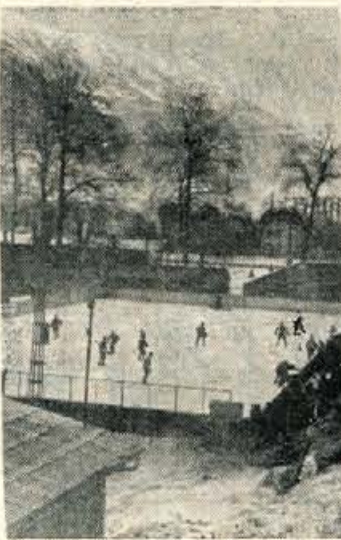
Pogled na jeseniško drsališče