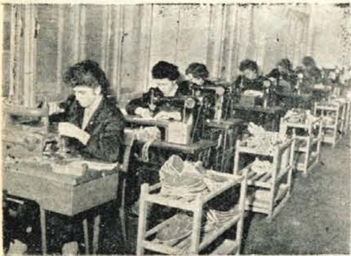
V novih prostorih čevljarne »Ratitovec« v Češnjici