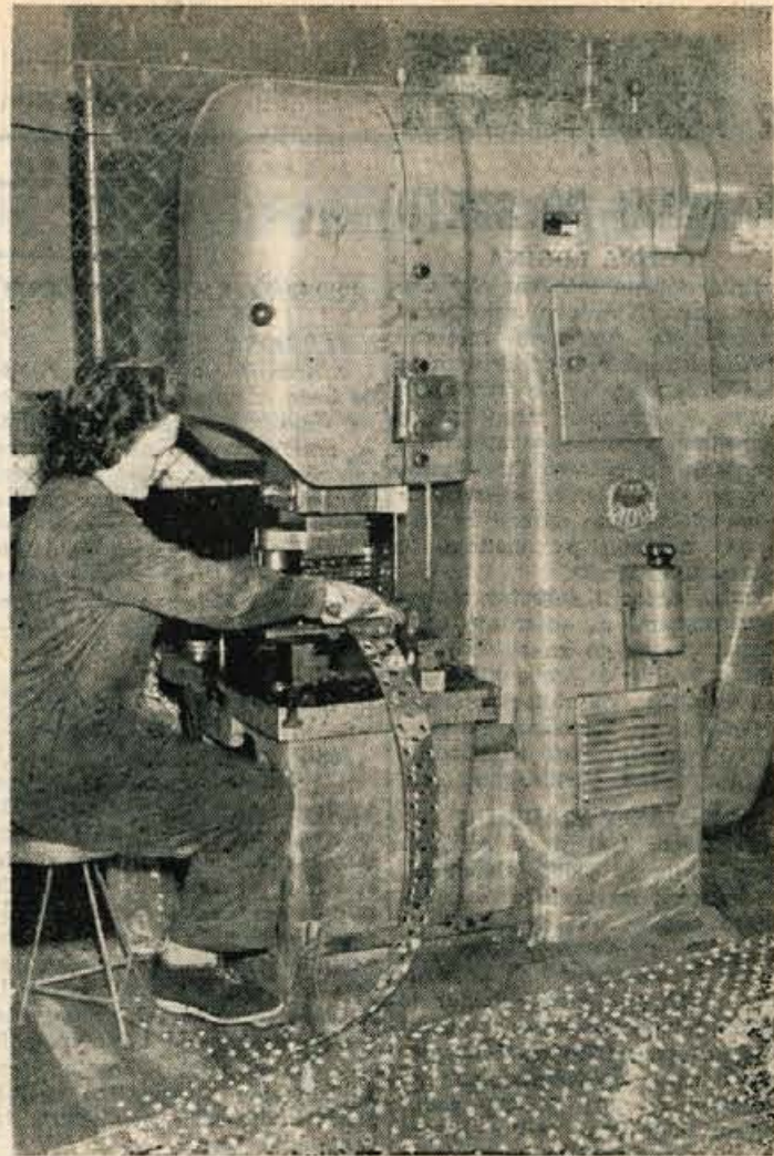
Zene se vse bolj uveljavljajo v proizvodnji in v organih delavskega in družbenega upravljanja