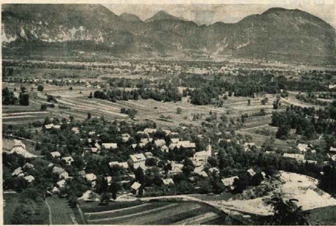
Iz leta v leto je Ribno mikavnejši turistični kraj

Vas Ribno je prijazen kraj blizu Bleda. Tjaka zelo radi zahajajo turisti poleti in pozimi. V vasi je precej kmetov, veliko pa je tudi delavcev in uslužbencev, zaposlenih na Bledu, v Lescah, na Jesenicah ali v Radovljici. V svoje okolice združuje Ribno tudi naselja Selo, Bodešče in Koritno. Vaščani teh naselij so pravzaprav tesno povezani s prebivalci Ribnega, saj jih združuje skupno delo v različnih družbenih organizacijah in društvih; imajo skupno kmetijsko združenje, in sicer v Ribnem; tamkaj jih združuje tudi Zadrudni dom, ki so ga zgradili pred leti in imajo v njem prostorno dvorano za pridelitve, razne družbene prostore in za organizacije, klubski prostor, v njem ima svoj sedež tudi kmetijska zadruga — skratka, vse se ob različnih priložnostih in potrebah shaja v velikem in ličnem Zadrudnem domu. Človek bi na prvi pogled sodil, da so se prebivalci teh naselij v mrzlih zimskih dneh zaprli v svoje hiše, koder čakajo blažjih »spomladanskih sapic«. Vendar