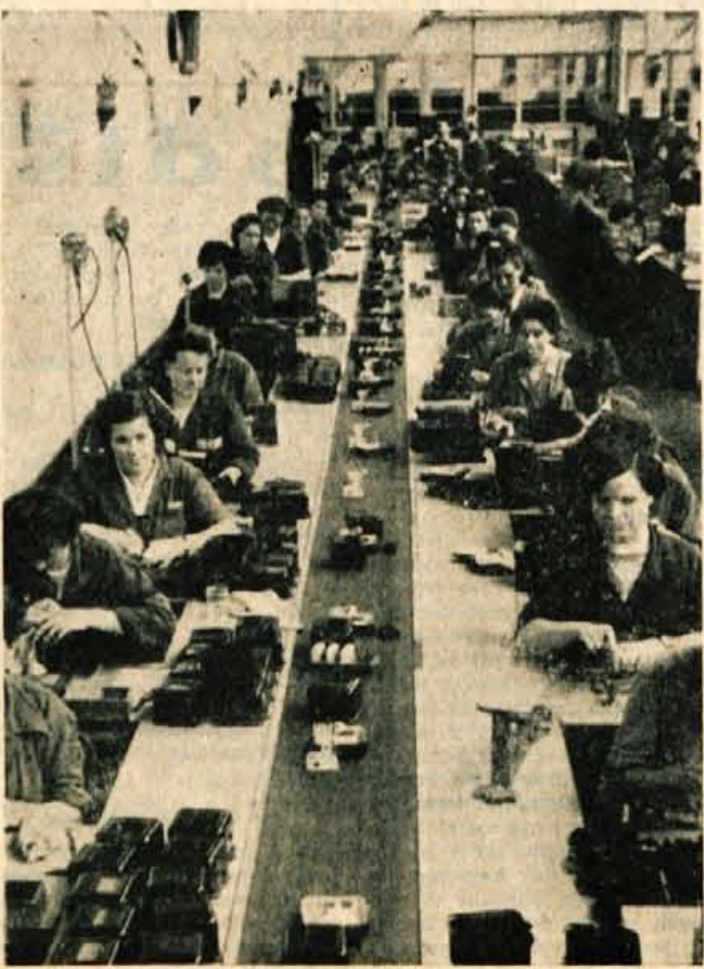
Montaža števcov na tekočem traku v tovarni «Iskra», Kranj

Nadalje so na plenumu razprav- ljali tudi o izobraževanju mladih članov DS. CK LMS večkrat orga- nizira v izobraževalnem centru v Bohinju razne seminarje za delav- sko upravljanje. Pri zbiranju pri- jav pa večkrat nastanejo težave in nerazumevanja pri UO posamez- nih tovarn. Imamo primere, da ne- katera podjetja niso prijavila niti enega mladega člana DS, na drugi