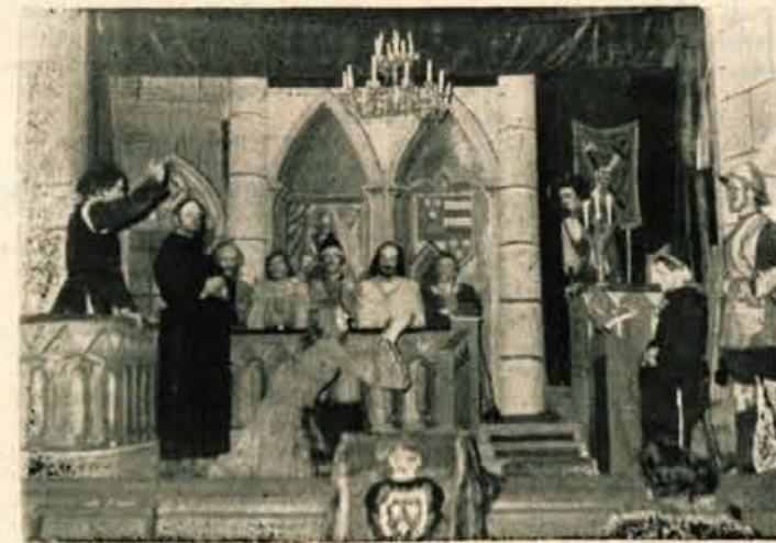
»Celjski grofje« na odru v Kranjski gori