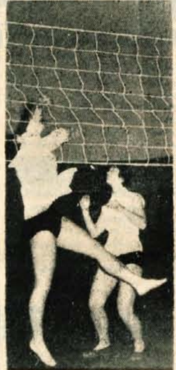
Zimski treningi se bodo kmalu končali in preselili se bomo spet na prosto

Za Ljubljane pa bi imel edino pripombo, da v vseh primerih ne znajo igrati fair. Ne znajo se zagristi v borbo za zmago in prenesti ostre igre, kot jo pravi hokej zahteva.«