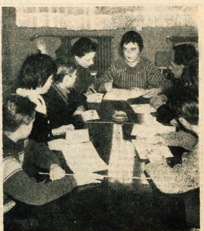
V reformirani šoli se vse bolj uveljavljajo šolske skupnosti, v katerih se otroci seznanjajo z osnovnimi pojmi samoupravljanja. — Na sliki: odbor šolske skupnosti «Lucijan Seljak» Kranj med sestankom