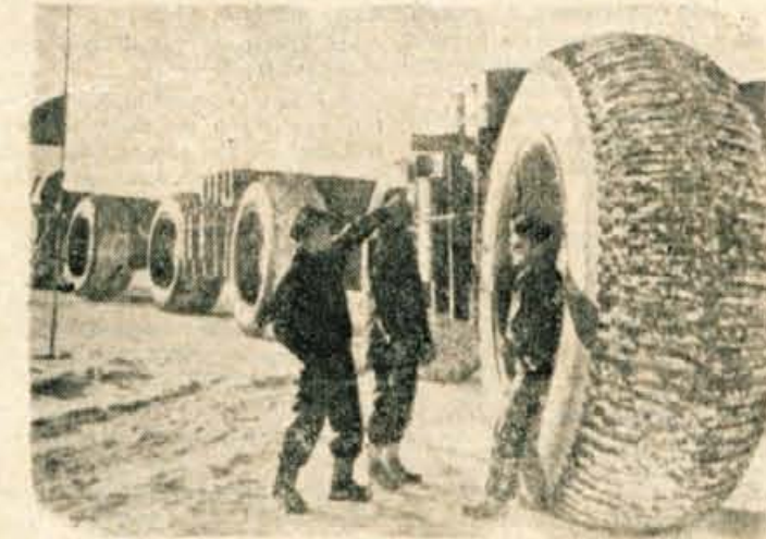
Ameriški vojniki so zaposleni v polarnih krajih s preizkušanjem novih vlačilcev, ki ustrezajo tamkajšim posebnim pogojem. Posvečajo se teh vozil, nadomeščajo naše sani in imajo 3 m premera.

Navpično: 1. Ostwald, 2. boj, 3. in, 4. LKK, 5. ors, 6. umik, 7. duc, 8. bh, 9. nari, 10. avtomat, 13. Ubangi, 16. al'air, 18. Seward, 20. to, 22. ga, 24. gb, 25. LR, 27. erat, 29. akuti, 30. Emine, 32. kam, 34. 37. vsak, 39. hiba, 41. affront, 42. Atol, 43. Engels, 44. klas, 46. turbina, 48. rtav, 49. Erna, 53. E'ku, 54. Graz, 55. selo, 57. O'bh, 59. ari, 60. sam, 63. B. K., 64. ve.