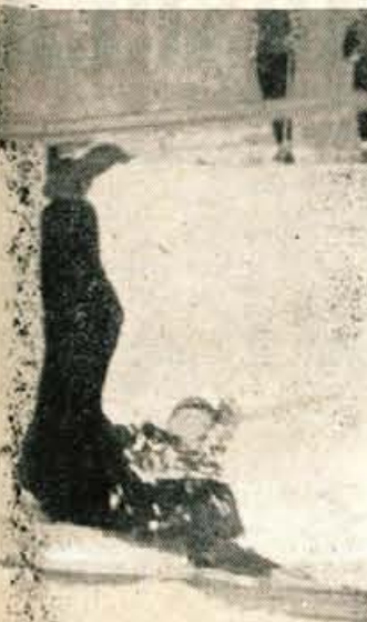
Tudi padcev ni manjkalo