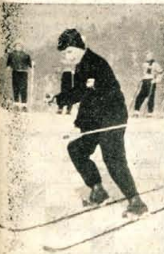
In sedaj, srečno vožnjo...