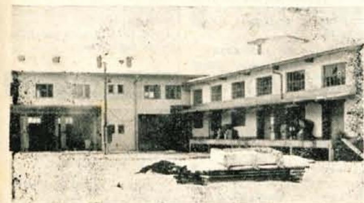
Veletrgovina »Loka« v Škofji Loki gradi eno največjih skladišč. Desni del skladišča že uporabljajo