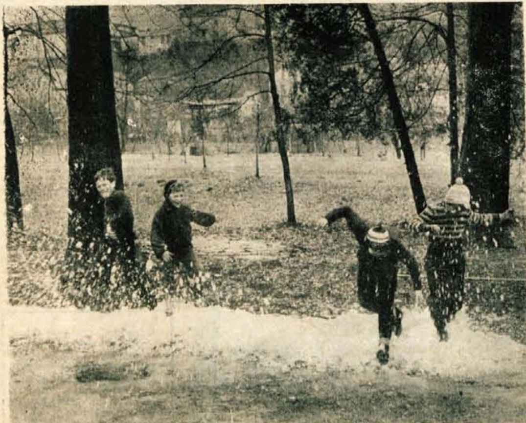
ZADNJE ZIMSKO VESELJE KONEC JANUARJA! Pa naj še kdo reče, da tudi letošnja zima ni muhasta, čeprav nam je v začetku meseca nasuila prgiščo snega.