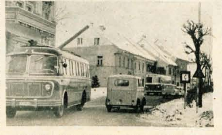
Promet od Zlatega polja do Labor je vsak dan večji

Izdaja CP »Gorenjski tisk« — Urejuje uredniški odbor — Direktor S. Beznik — Odgovorni urednik Voljo Novak — Tel. uredništva 475 — Uprava 397 — Tekoči račun pri Komunalni banki v Kranju 607-70-1-135 - Izhaja ob ponedeljkih, sredah in sobotah — Letna naročnina 900 dinarjev, mesečna 75 din