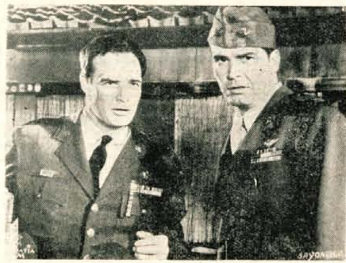
Prizor iz filma SAYONARA, ki smo ga v preteklih dneh gledali v Kranju

liko prikriti obliki le obsodba rasne diskriminacije. V prikriti obliki zavestno ali podzavestno, to je težko reči. Zdi se mi, da je kot vzrok tragičnemu koncu premalo poudarjena rasna nestrpnost belcev do rumenopolnih Japoncev (na čemer bi morala producent in re-