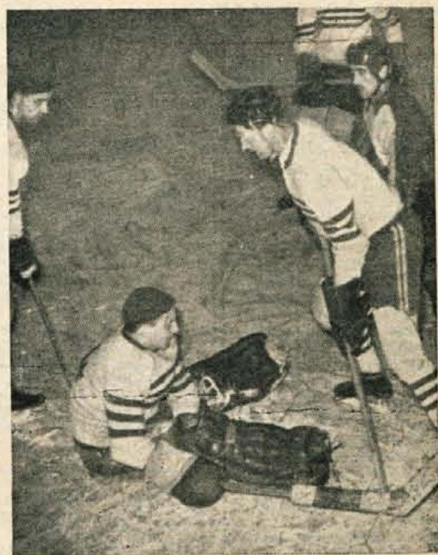
Nocojšnje srečanje v hokeju na ledu med Ljubljano in Jesenicami ob 19.30 uri (na Jesenicah) bo vsekakor eno najzanimivejših v razburljivem letošnjem državnem prvenstvu

zainteresiral vsakega natakarja, vsako kuharico, da jim ne bo vseeno, če so vrata zaprta ali ne. — Odgovor na vprašanje, kdaj naj gostinci praznujejo in kdaj naj delajo, bo lažji. To pa je tudi glavni namen novega načina nagrajevanja.