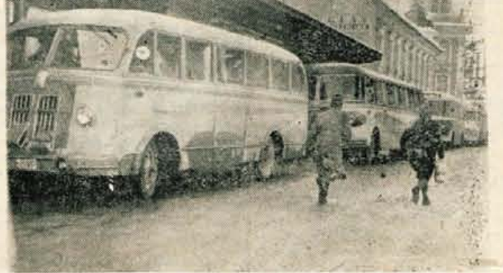
Ko avtobus za Tržič odpelje, čaka za njim že cela vrsta drugih avtobusov... za Cerklje, Golnik, Senčur, Visoko, Ljubljano itd.

Od dveh do treh popoldne, pa tudi sicer, je na avtobusni postaji v Kranju vsak dan zelo živahno, predvsem pa v dneh, ko dežuje ali sneži, ker ljudje ne morejo na delo s kolesom. Na sliki: ura manjka približno deset minut do treh; po zvočniku se zaslisi glas: »Avtobus v smeri Naklo, Duplje, Tržič ima odhod. Potniki vstopite!«