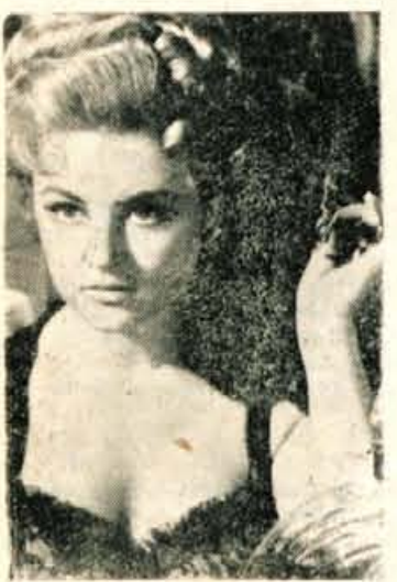
Iz filma LEPOTICA IN CIGAN, ki ga bomo danes zvečer gledali v Storžiču

Angleški barvni film v kinoskopski tehniki ... KER VETER NE ZNA BRATI (produkcija: J. A. Rank Organisation, 1958; režija: Ralph Thomas; scenarij: Richard Mason po svojem istoimenskem romanu; v glavnih vlogah: Dirk Bogarde, Yoko Tani, Ronald Lewis) je zgodba o prepovedani ljubezni med poročnikom angleške vojske Michaelom Quincom (Dirk Bogarde) in Japonko Suzuki Sam (Yoko Tani), ki je v New Delhiju poučevala angleške vojake japonščino. Čudoviti barvni posnetki New Delhija, njegovih arhitektonskih zanimivosti in življenja ljudi, indijske ter korejske pokrajine z nevtrnim puščavskim peskom in v tem ter živopisnim cvetjem in nenavadnimi živalmi, to so posebne odlike filma, ki hoče biti v neko-