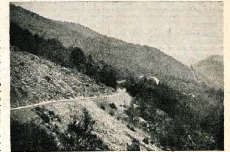
Bogastvo gozdov na Menini planini bo dostopno

Zaradi potreb po izgradnji ceste, so bila v letu 1956 vložena