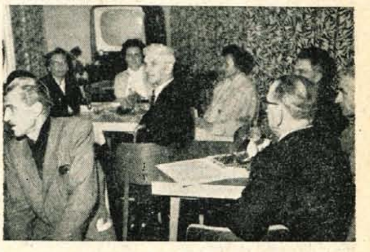
V soboto dopoldne so kranjski invalidi otvorili klub