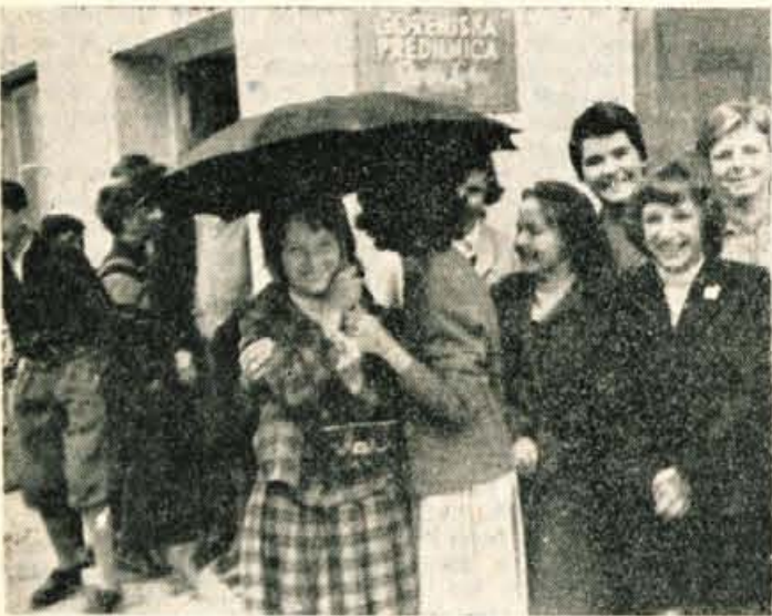
118 mladih ljudi - novospredeti mladinca in mladink iz osnovne šole v Skofji Loki, si je minuli teden ogledalo delovni proces v Gorenjski predilnici. Na sliki jih vidite tik pred vhodom v tovarno

Tržič - Delavska univerza v Tržiču je s sodelovanjem Okrajnega odbora zveze esperantistov Kranj organizirala tečaj esperantskega jezika za začetnike, ki bo vsak tork na osemletki v Tržiču in bo trajal predvidoma do konca tega leta. Zanimanje za ta tečaj je precejšnje, saj se je prijaviło 26 kandidatov.