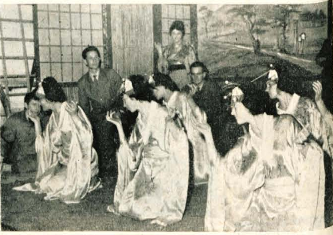
V Tržiču so imeli v soboto, 22. oktobra, že drugo letošnjo premiero, in sicer G. Kaiserja -Vojaka Tanako- v režiji Smoleta. Po dolgotrajnem studiju v majhni sobici Glasbene šole so imeli samo eno vajo na odru. Pisali smo že, da so tržiški ljubitelji oderskih desk brez svoje dvorane in da so gost kinopodjetja, kar pomeni, da dobe prostor za vaje šele po končanem filmskih predstavah. Sprašujemo se, koliko časa bodo in kako bodo pod takimi pogoji lahko še igrali?

Na križišču v Starem dvoru pri Skofji Loki je prišlo v četrtek, 20. oktobra ob 17.30 uri, do prometne nesreče. Voznik poltovornega avtomobila S-11755 je peljal iz Trate, vendar s preveliko hitrostjo. Na križišču je pred prihajajočim avtomobilom prečkal cesto K. H. tako, da je prišlo do trčenja. Vzrok nesreče, pešec je bil namreč smrtno poškodovan, sta bila vsekakor prehitra vožnja in neprevidnost pešca. -an