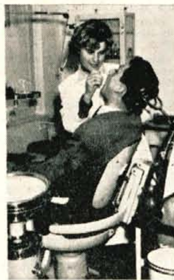
Pred nedavnim so Žiri dobile na koncu Zadrudnega doma novo ambulanto, v kateri je splošna ordinacija in zobna ambulanta. Skoda je le, da v Žireh primanjkuje zdravstvenega kadra. Na sliki: delo v zobni ambulanti.

Z uvajanjem novih obrtnih dejavnosti, je v Žireh postal tudi precej pereč problem stanovanj. Tovarna »Alpina« je zgradila za svoje delavce šeststanovanjski blok, osemstanovanjski pa je v gradnji. Prav tako so tudi za učiteljsvo zgradili v Žireh šeststanovanjski blok. Gotovo bodo predvidela gradnjo stanovanj obrtna podjetja; občinski sindikatni svet pa že dela na uvedbi zadrudne gradnje stanovanjskih vrstnih hiš. Precej pa bodo pridobili za varstvo otrok v Žireh,