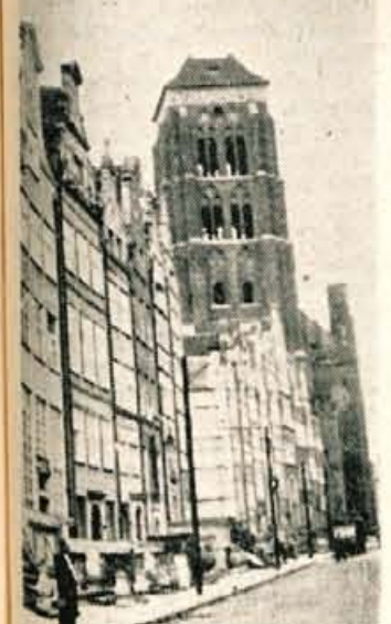
Glavna ulica v Gdanku

Pšenica pozimi pod snegom ne zmrzne. Nasprotno, prav toplo ji je. Toda zakaj? Stvar je prav preprosta. V snegu je precej zraka, in sicer okrog 80 odstotkov. Če ne verjamete, ob prvem snegu naredite tale poiskus: 10 litrsko posodo napolnite s snegom in ga na toplem stopite. Dobili baste le 2 litra vode. Zraka je tudi drugod dovolj. V lesu ga je na primer 70 odstotkov, v borbažni tkanini okrog 50 odstotkov, v volni pa okrog 90 odstotkov. Zato je tudi volnena tkanina toplejša od bombaža.