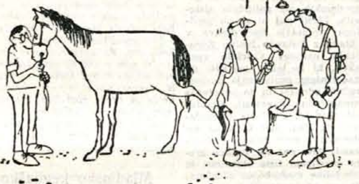
«Glej, da boš dovolj nežen...»