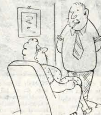
«Si že pomil posodo...?»