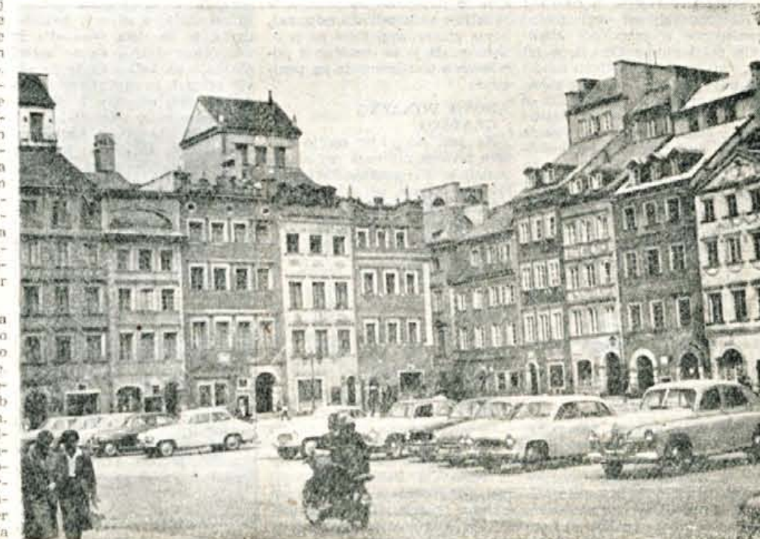
Stari trg v Varšavi — obnovljen po vojni

Največja in najlepša kuriozita Varšave pa je vsekakor «Stari trg», ki je bil zgrajen v 15. stoletju, a med poslednjo svetovno vojno do tal porušen. Po vojni so ves stari del mesta obnovili v istem starodavnem slogu. Zakaj? Poljaki bi verjetno lahko za manjše denarje zgradili na tem mestu novo moderno mesto, s širokimi alejami