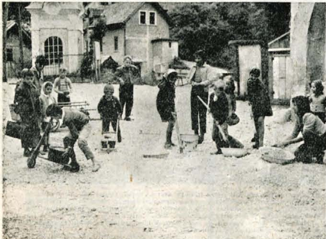
Novo stanovanjsko naselje v T-žici »na fabriki«, bo končno ventlarje dobilo podoba kakršno gre takšnemu naselju. Urejevanje so se seveda lotili najmlajši. Pred dnevi jih je zalotil naš foto-reporter pri urejanju cestnišča. Brigada mladih je kajpak pošteno zagodila starejšim, predvsem pa odbornikom v hišnih svetih in stanovanjski skupnosti.