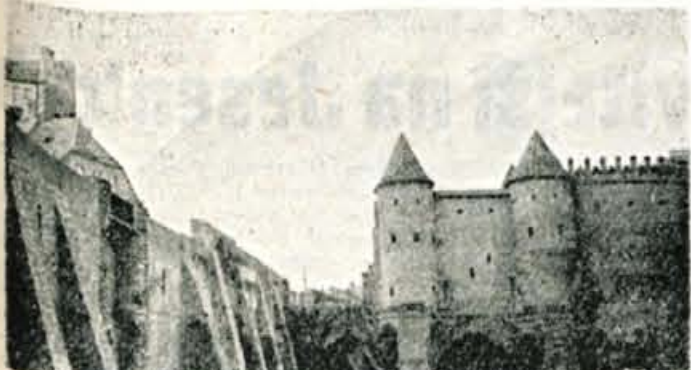
Obzidje s trdnjavo ob vhodu v stari del mesta

Vsekakor je Varšava v vseh pogledih velemesto. Avtomobilski promet je močno razvit in moderno urejen; toda praktično vidiš le avtomobile dveh tipov — Varšava in Volga. Na vseh križiščih so semaforji. Tudi za zabavo je preskrbljeno, saj je tu mnogo zabavišč in nočnih lokalo, ter se lahko zavrtiš ob najmodernejših ritmih ter piješ rusko vodko in ruski šampanjec, lahko pa tudi najboljši francoski konjak in škotski whiskey; lahko pa si začelši tudi našega zelenega silvanca.