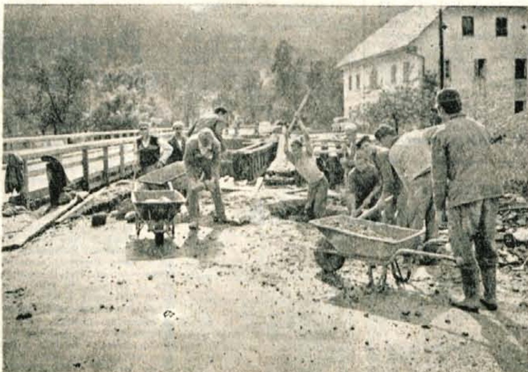
Tudi v Dolenji vasi so se z vso vnemo lotili gradnje novega mostu in v kratkem bo šla skozi Selško dolino cesta, ki za promet ne bo več kamen spotike

Kranj - Pretekli mesec se je v tovarni Iskra, v organizaciji tovarniškega komiteja LMS in ob pomoči izobraževalnega centra, začel enomesečni seminar za mladinske aktiviste. Na spore u imajo 14 predavanj iz vseh področij dejavnosti. Seminar je štirikrat tedensko in ga obiskuje približno 30 mladincev in mladink, članov sekretariata tovarniških aktivistov. Seminar je organiziran po popolnoma istem sistemu, kot jih organizirajo v mladinskem izobraževalnem centru v Bohinju, le s to razliko, da je tu v popoldanskem času, in sicer vsakokrat po 3 ure.