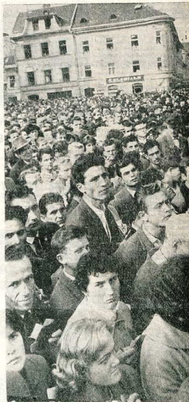
Včeraj na tomboli v Kranju

Na sestanku stanovanjske skupnosti so se sporazumeli za gradnjo garaž za motorna vozila, ki jih bodo gradili s skupnimi sredstvi stanovanjske skupnosti in lastnikov avtomobilov. Po amortizaciji vložene vsote bodo garaže prešle v lastništvo stanovanjske skupnosti.