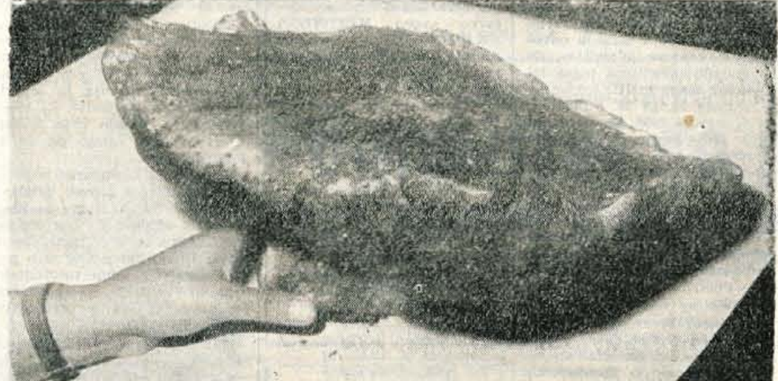
V poključkih gozdovih je te dni našel upravnik Šport-kluba 4,80 kg težko gobo »jurček«

pred osmimi leti sprejel kandidaturu, je moral odložiti svoj generalski čin.) Če bi spet postal general, bi prejemal letno še 20.543 dolarjev generalske plače. V ameriški vojski namreč generali ne poznajo upokojitve, temveč so do svoje smrti »aktivni«. Generalu pa potem pripada še štab petih častnikov in petih podčastnikov ter dve limuzini.