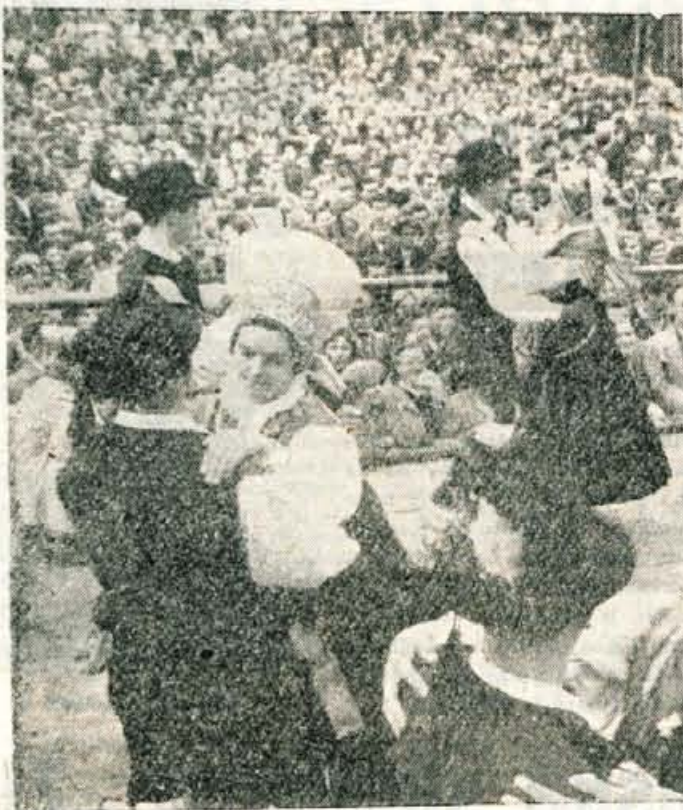
Veselje na kravjem balu