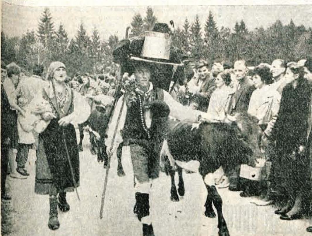
Prihod planšarjev s planin