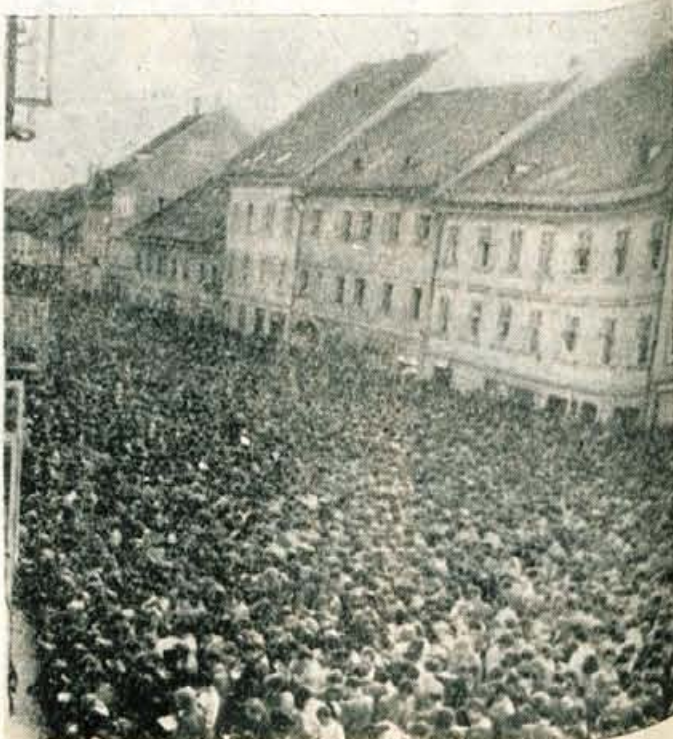
Mravličičeva na Titovem trgu v Kranju