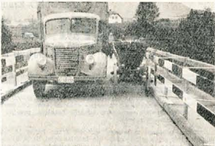
Srečanje dveh vozil, ki sta običajni na suškem mostu. Pogost pojav, ki zgovorno priča, da nekateri vozniki še vedno premalo upoštevajo prometne znake. Nesreče so zato neizbežne. Tudi ta slika nam to priča; vsa sreča, da ni bilo pri srečanju poškodb