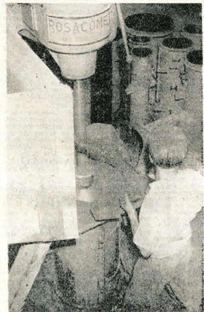
Strojno izdelovanje cementnih cevi