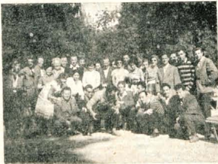
Skupina jeseniških svobodasev v Beljaku pred odhodom domov

SVOBODA JESENICE ZOPET PRVA, ki je koristila malobrnejnemu prometu za kulturno sodelovanje s Slovenci na Koroškem, zato naj ne ostane osamljen primer, saj so naši rojaki onstran Karavank željni in potrebni podobnih gostovanj in prireditev.