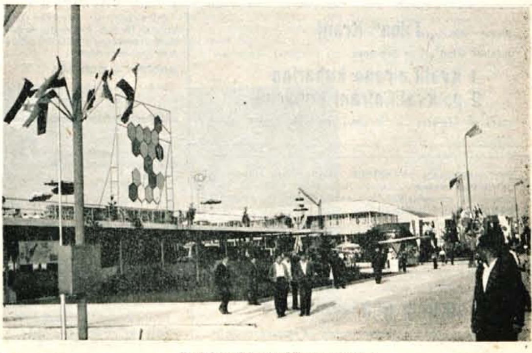
Pogled na del Zagrebskega velesojma

Komisija bo predlagala IO naj vsa podjetja z nadpovprečnim % nesreč povabi na skupne sestanke, na katerih bi se skupno z upravami podjetij, člani delavskega samoupravljanja in zastopniki zavoda pomenili kako znižati število nezgod pri delu, ki zmanjšujejo uspehe podjetij in grenijo življenje delavcev in njihovih družinskih članov.