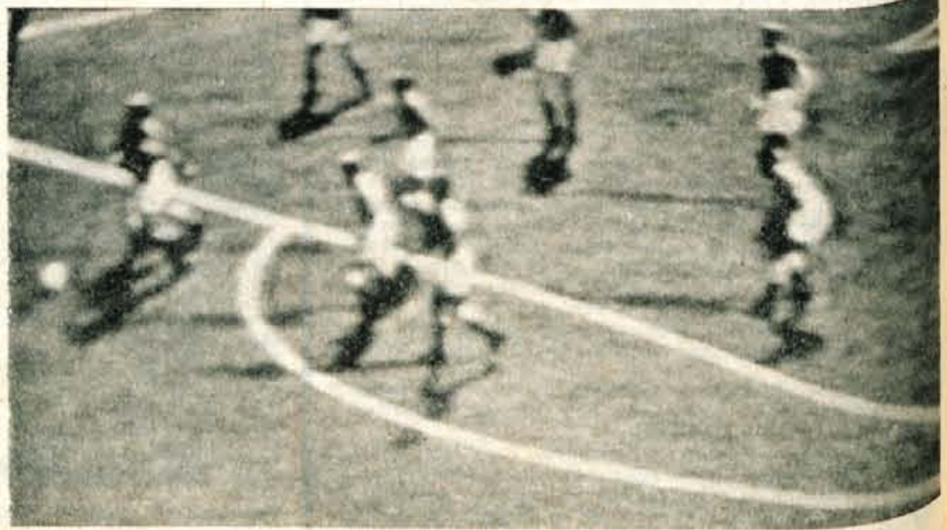
Z olimpijskega finala v nogometu med Jugoslavijo in Dansko