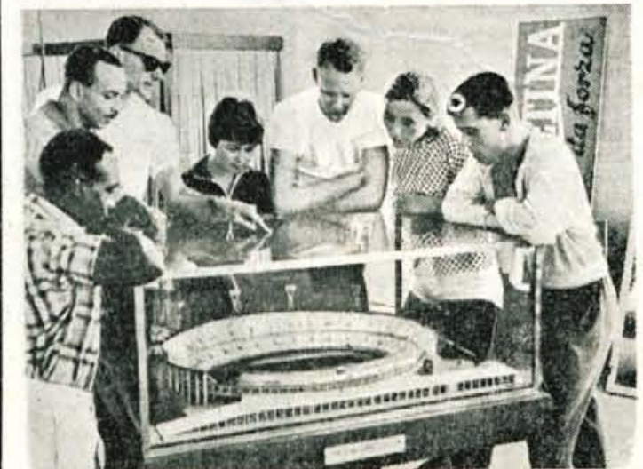
Vsepovsod po olimpijski vasi smo lahko naleteli na navdse mešane skupine športnikov. Ta, na naši sliki, si ogleduje model svečanega stadiona v Tokiu, kjer bodo leta 1964 zopet olimpijske igre