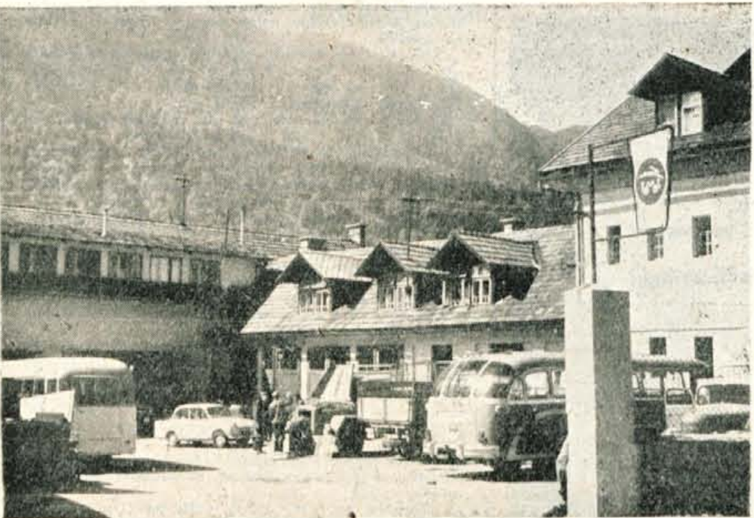
Delovni kolektiv jeseniškega Avto-servisa ima vsak dan obilico posla, ki ga izvršuje z naj- uspešnim uspehom. To potrjuje tudi rezultat polletnega plana, ki je visoko prekoraleen

Komisija za prometno varnost in vzgojo v prometu pri OLO Kranj je na svoji seji sklenila, da bo podelila lepo pisemno priznanje vsem tistim šolam po Gorenjskem, ki so pokazale v času prve prometne akcije pod naslovom »Na cesti nisi samonajveč uspehov in prizadevanj. Predloge za poljave, oziroma priznanja, bodo izdelale občinske komisije za prometno varnost.