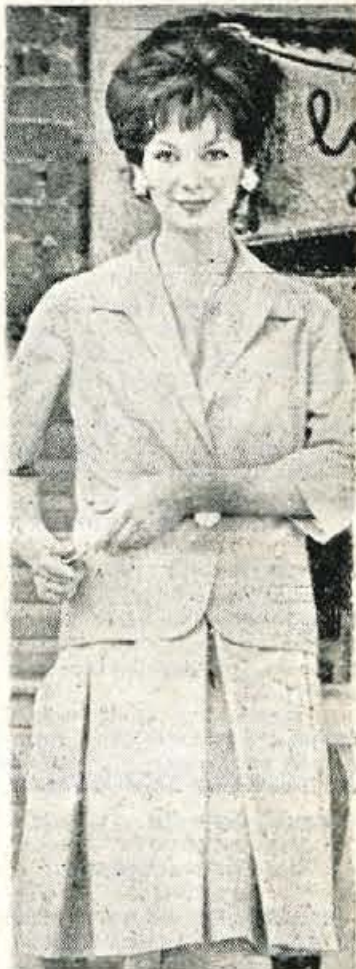
Iz lahkega volnenega blaga za prehodne dni