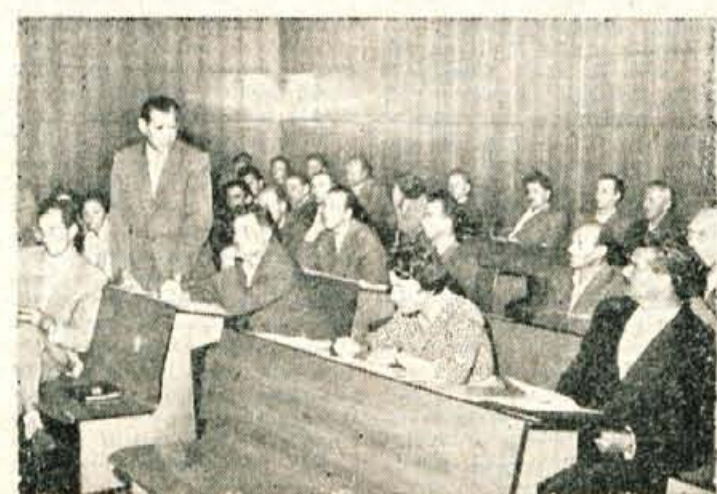
Z zasedanja skupščine OZSZ

Priznanje za »Jugoslovanski Oskar za embalažo 1960« je obljubil Center za embalažo in napredek trgovine pri Trgovinski zbornici za LRS. Razumljivo je, da je bilo največ razstavljenih na tudi nagrajenih modelov prav iz vrst prodajne embalaže. Letos je bilo komisiji predloženih 120 modelov embalaže, od tega