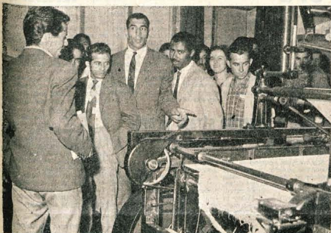
KRANJ, 6. septembra - Včeraj dopoldne je 20-članska mladinska delegacija iz Maroka, ki se te dni mudi na Gorenjskem, obiskala najprej tovarno Sava, za tem pa še tekstilno tovarno Inteks. Gostim iz Maroka je v hotelu Evropa nato tovarna Sava priredila svečano kosilo. Takoj za tem pa so se maroški mladinci odpeljali na Bled, Jesenice in Bohinj, kjer bodo ostali nekaj dni