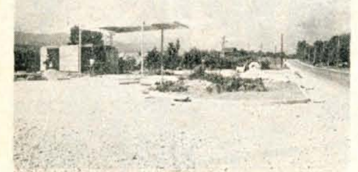
Vzporedno z naraščanjem motorizacije je vse bolj potrebna tudi gradnja bencinskih črpalk. Na sliki: gradnja črpalke v Kranju