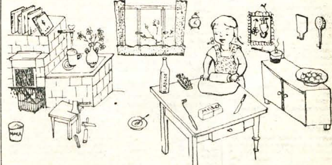
Risar se na tej risbi kar 22 krat zmotil. Gotovo boste našli vseh 22 napak.