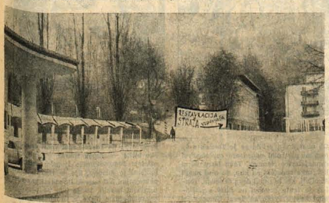
Nova avtobusna postaja na Bledu in urejeno sprehajališče do grandhotela »Toplice«