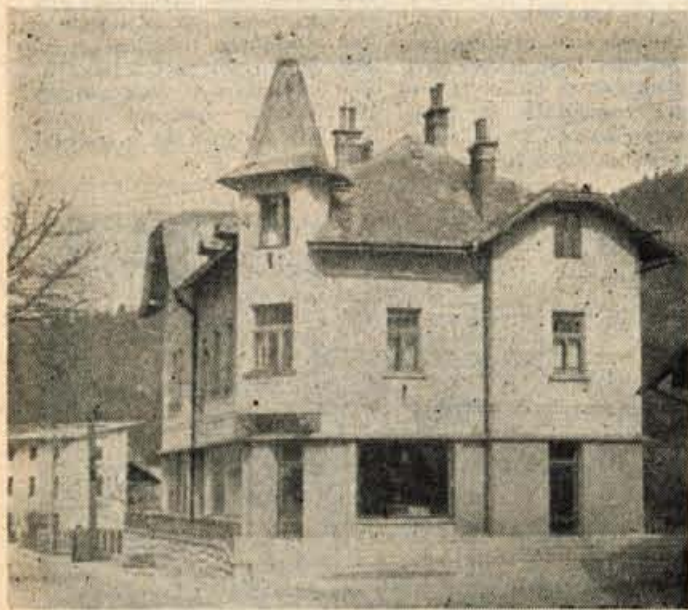
V Bohinjski Bistrici bodo 1. aprila dobili nove trgovske prostore. V poslojpu (na sliki) že dlje urejajo dva lokala: v prvem bo manufaktura in galanterija, v drugem pa špecerija.