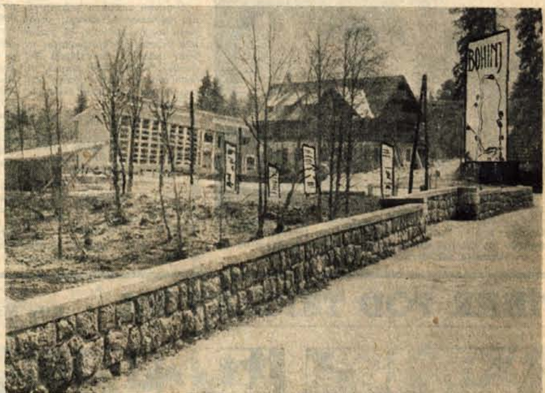
Pogled na novo poslopje ob hotelu »Jezero« v Bohinju

Pri Lescah, kjer se odcepi pot proti Bledu, smo imeli kratko postajo. Sofer si je založil za motor novega goriva pri bencinski črpalki.