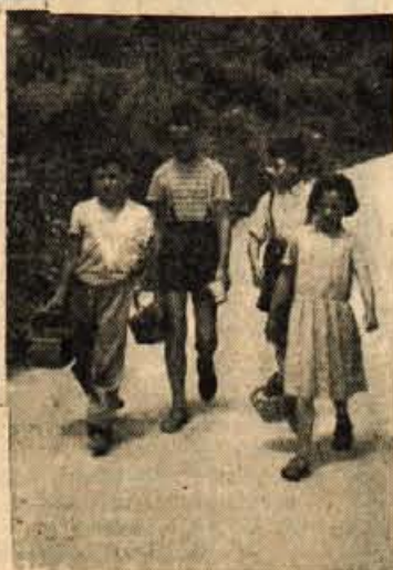
Zgoraj: Prebivalci ob cesti Hrastje—Prebacevo se bodo iznebili zoprnega in nehigijskega prahu, kajti cesta v teh dneh dobiva asfaltno prevleko. — Desno: Letos borovnice niso obrodile kaj posebno dobro, zato se nabiralci s praznimi posodami vračajo domov.