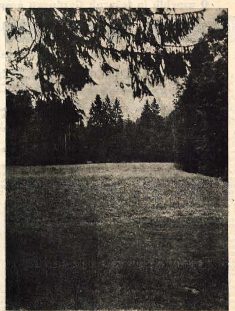
MOTIV Z RUPE PRI KRANJU kjer bo 16. septembra praznovanje 20. obletnice velike tekstilne stavke

Izdaja: Gorenjski tisk / Ureja: Uredniški odbor / Odgovorni urednik: Slavko Beznik Telef. uredništva 475 — uprave 475 Tekoči račun pri Komunalni banki Kranj št. 01-KB-1-Z-135 / Izdaja v ponedeljek in petek / Naročnina: letna 600, pollet. 300, mesečna 50 din