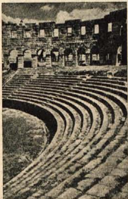
Gledališka arena v Puli

filmskega festivala bodo po vsej verjetnosti lahko videli nekaj vrhunskih stvaritev svetovne kinematografije kot so n. pr. »Svet tišine«, »Rdeči baloni«, »Streh«, »Carmen Jones«, veliki sovjetski cinemascope film »Ilja Murovec« itd. Prireditelj v Puli bo obiskalo tudi veliko število inozemskih filmskih umetnikov, distributerjev, novinarjev itd. MILAN LJUBIČ