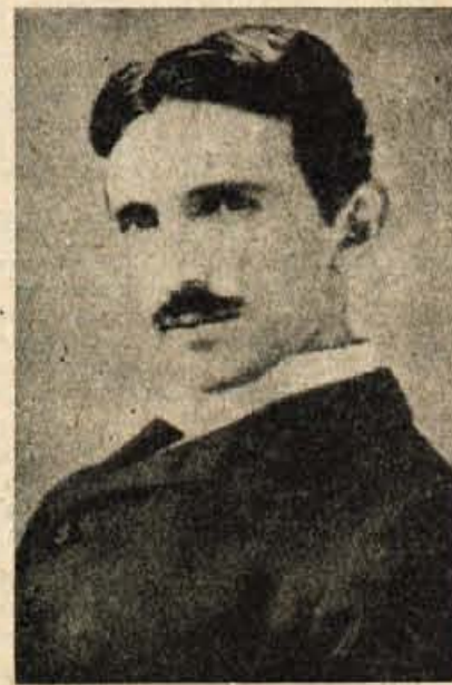
NIKOLA TESLA (1888)

Prav ti dokumenti in vsa njegova zapuščina pa bodo končno pojasnili svetu, kdo je bil Nikola Tesla. Danes imamo šele možnosti, da ga predsta- vimo svetu takšnega kot je bil ter da se s tem oddolžimo svojemu največ- jemu rojaku, ki v takratnih razmerah ni mogel svojih idej realizirati doma, v svoji domovini, temveč v tujini.