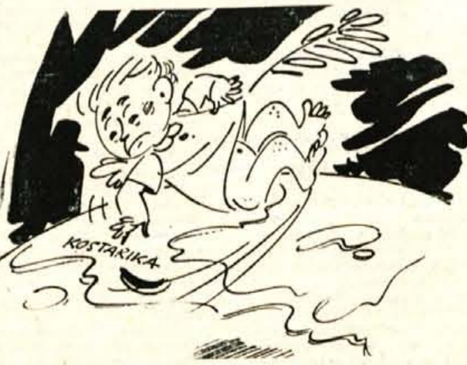
Alli mi je spodrsnilo na banani!

je kmalu razbila, zaradi notranjih sporov, največ pa zaradi interesov velikih sil, ki jim ni bilo po godu, da ta strateško važen predeji zajema ena sama država.