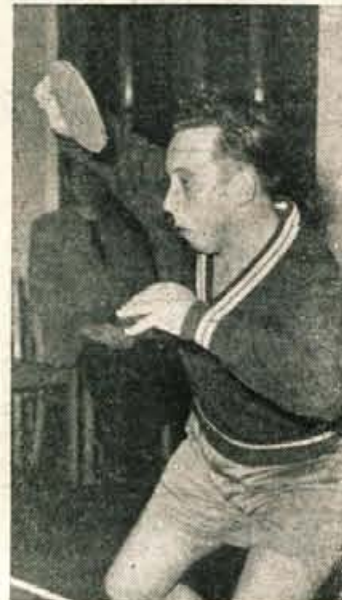
Refko klobuta belo žogico

V LETOSNJEM LETU bodo obhajali kranjski »pinkponkaši« majhen jubilej — 10. obletnico obstoja namiznega tenisa v Kranju. Za ta svoj praznik pripravljajo igralci velik mednarodni namizno-teniški turnir mest, na katerega so že povabili dve moštvi iz Avstrije, po eno iz Ze-