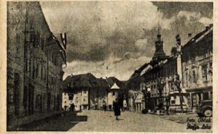
Škofja Loka: lep primer zaključenega srednjeveškega trga.

ZIVEL II. OBČINSKI PRAZNIK DELOVNEGA LJUDSTVA SKOFJE LOKE!