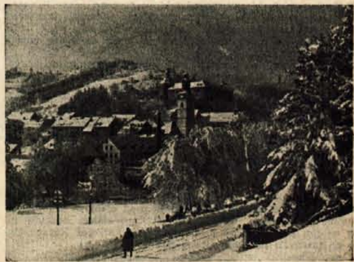
ŠTEVILNIM ČESTITKAM OB OBČINSKEM PRAZNIKU MESTNE OBČINE ŠKOFJA LOKA SE PRIDRUŽUJE TUDI NAŠE UREDNIŠTVO. SLAVNE TRADICIJE NOB NAJ BODO LOČANOM TUDI V BODOČE VODILO.