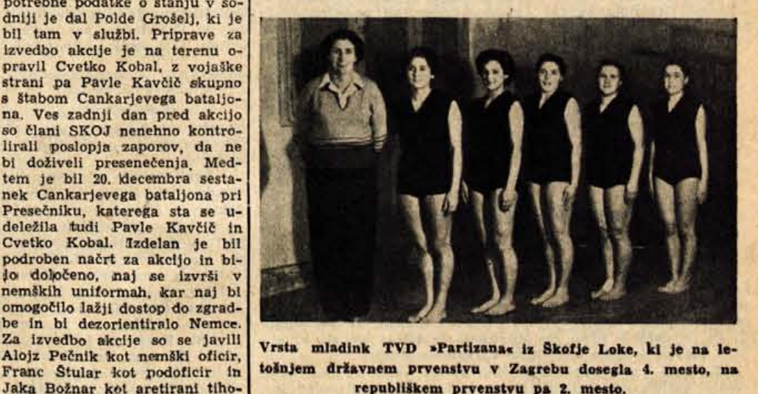
Vrsta mladink TVD »Partizana« iz Škofje Loke, ki je na letošnjem državnem prvenstvu v Zagrebu dosegla 4. mesto, na republiškem prvenstvu pa 2. mesto.

veliki tudi odbojarska in košarska sekcija, ki sta pripravili vrsto tekmovanj in dosegli že prve uspehe (odbojkarji v Medvodah, Idriji in Trzišču; košarkarji v Loki, Kranju in na Jesenicah). V gorenjski nogometni podzvezi je nogometna sekcija sodelovala kar s tremi ekipami: s pionirji, mladinci in I. moštvo. Ustanovili bodo tudi namiznoteniško sekcijo. Za letošnji občinski praznik je šahovska sekcija društva organizirala lepo obiskano simulantko z republiškim mladincu. Od posameznih vrst so bili