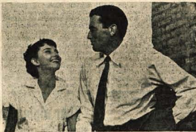
Audrey Hepburn in Gregory Peck

ga krasijo velike, nekoliko poševne oči, je tak, kot ga vsakdo rad vidi. Audrey je visoka,