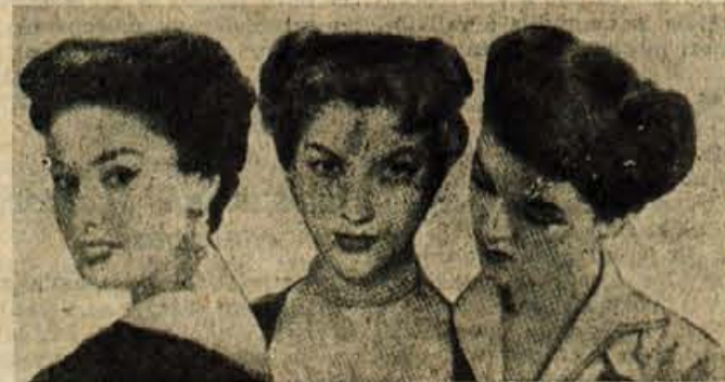
Frizure s kratkimi, rahlo nako ranimi lasmi, ki poudarjajo mehko obliko obraza, so letos osvojile svet

Tudi izbira frizure zahteva od nas precej pozornosti. Letošnja zimska moda še vedno priporoča kratke lase z lahimi kodri usmerjenimi od ušes proti čelu. Pričeska naj bo torej mehka in valovita.