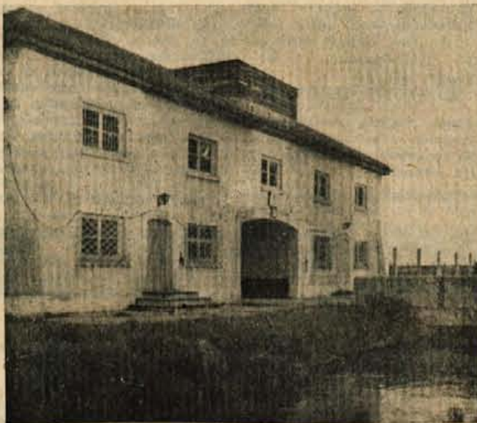
Vhod v bivše koncentracijsko taborišče Dachau

Pretresljiv je nadalje pogled na skromno leseno ploščo, ki stoji v žrelo krematorija. Nanjo so prebivalci neke hribovske francoske vasi napisali vrsto imen v Dachauu uničenih sovražnikov. V kleti krematorija je delegacija videla majhen stroček — mlin, ki je služil za mletje tistih človeških kosti, ki jih ogenj krematorija ni mogel dočela sežgati. V ozkem hodniku za krematorijem je celo omrežje raznih cevi in odprtina, skuzi katero so gestapovci dovajali plin v plinsko celico, v kateri so s ciklonom morili jetnike. V Dachauu je dandanes možno videti tudi še 150 samotnih celic (bunkerjev). Grajeni so tako, da tisti, ki so ga kaznovali, v njej ni mogel ne stati ne sedeti. Za krematorijem je tudi vrsta pasjih hišic za esesovske volčjake, ki so jih naučili pobadati ljudi. Tudi tako imenovani krvavi jarek z lesenimi rešetkami, kjer so esesovci streljali v tinik na rešetkah klečeče jetnike, je še ohranjen. Nedaleč od starega in novega krematorija v Dachauu, zadaj za žico in vodnim jarkom taborišča, je še pred enim mese-