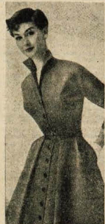
Lahka volnena obleka, ki se za- penja kot halja, za našo delovno ženo