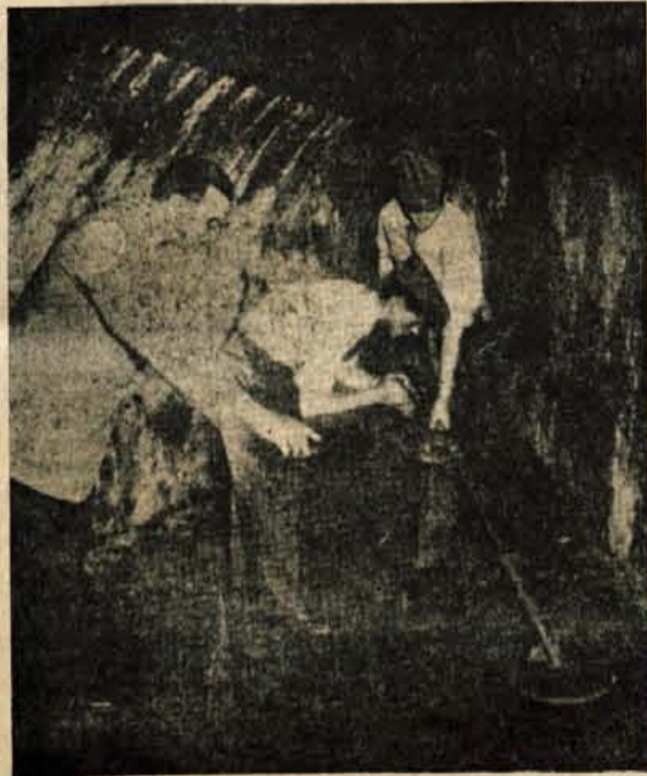
Raziskovanje elsinorskega podzemlja

Napis iz Elizabetinskih časov na Shakespeareovem nagrobnem spomeniku je že zdavnaj zanimal številne strokovnjake, kajti še danes so prepričani, da je verzje sestavil pesnik sam in nekaj dni pred