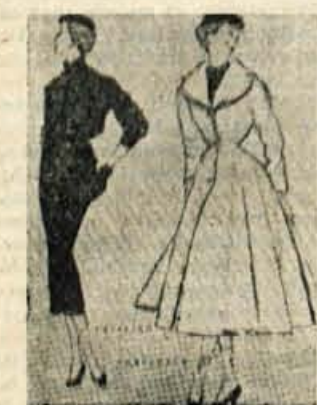
Jesenski kostim in plašč, katerih linija se v letošnji jeseni ni bistveno spremenila