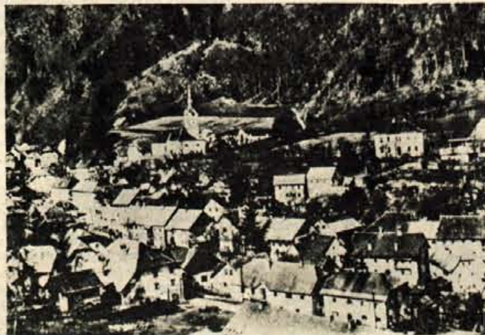
Staro železarsko naselje Kropa

V stari železarski Kropi so v nedeljo, 3. oktobra, predali javnosti »slovenske peči«, davno pričo dela kroparskih kovačev, ki so že v začetku 15. stoletja v njej talili rudo iz osrčja Jelovice.