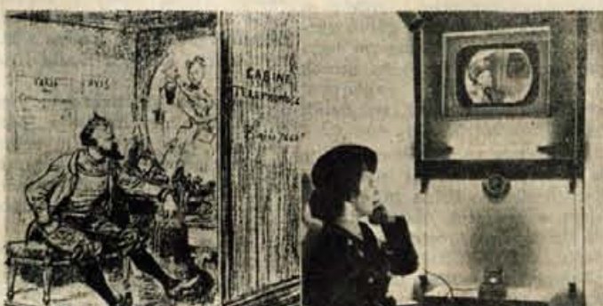
Levo: Robidov »telefonoskop« (1883), nameščen v javnih govorilnicah, naj bi služil javnosti za telefonski pogovor s prenašanjem glasu in slik. — Desno: V Fort Monmouth, New Jersey, se pogovarjata dva pripadnika ameriške armade na dvojen način: z glasom in s silko.

Fantazija tega slikarja s slovansko zvenečim prilmkom je ustvarila na tisoče risb, slik in skic ter kopico knjig. Tako je leta 1880 presenetili svoje bralce tudi z nenavadnimi podobami »električne dobe«, ki je popolnoma podobna današnji resnični »elektronski dobi«. Na Robidovih risbah so prikazani celo tako moderni izumi kakor so zabava in oglašanje po televiziji, radijska oddaja poročil in glasba s plošč. Večkrat smo že videli po časopisih fotografije najnovejšega telefoniranja, zvezanega s televizijo, kar skoraj docela ustreza prizoru, ki si ga je zamislil Robida že leta 1880. Robidova risba prikazuje »telefonoskop«, aparat, ki bi ljudem omogočil, da bi videli med telefoniranjem drug drugega na zaslonu. Skica in fotografija, priobčeni skupaj, sta bili narejeni sedemdeset let nazaj. Na neki drugi fantazijski sliki lahko vidimo »radijskega dopisnika«, kako oddaja opis nekega zunanega dogodka kar s kamelina hrbta. Ta dromedar je predhodnik današnjih avtomobilov — oddajnikov, ki jih imajo velike radijske agencije za svoje reporterje. Tudi televizijsko zabavo je Robida popolnoma jasno orisal na svojih nenavadnih slikah. Njegova priljubljena tema je bil televizijski prenos iz opernega gledališča, kar bi si danes lahko ogledal tako v Evropi kot v Ameriki. Takoj so se izpolnile Robidove nenavadne vizije.