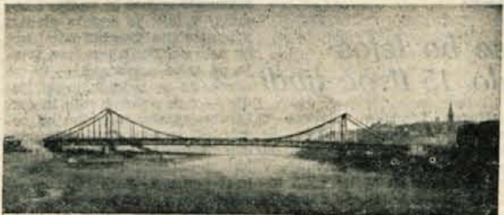
Porušeni most čez Savo v Beogradu

kar pomeni, da bi prihranili težke milijarde deviz, ki jim marsikje res ne moremo nadomestiti z domačo proizvodnjo. In kaj je kamen spotike? Mestni ljudski odbor Beograda hoče imeti lep viseč most, ki pa ga sami ne moremo zgraditi. Zbog gre za odločitev: ali drag viseči most za devize ali prav tako lep navaden in cenejši most iz domačih sredstev. Spričo tolkšnega pomankanja