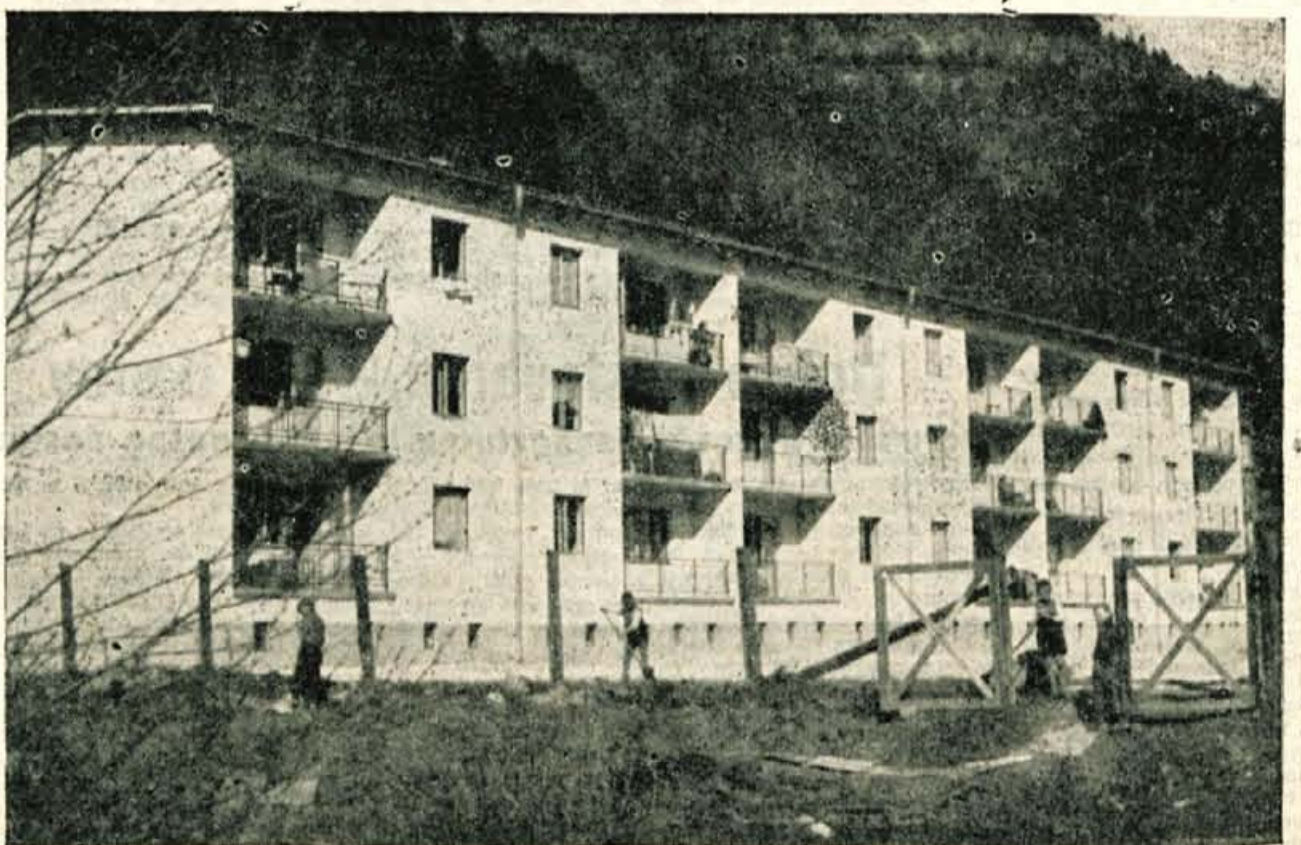
Po vojni zgrajeni stanovanjski blok na Jesenicah