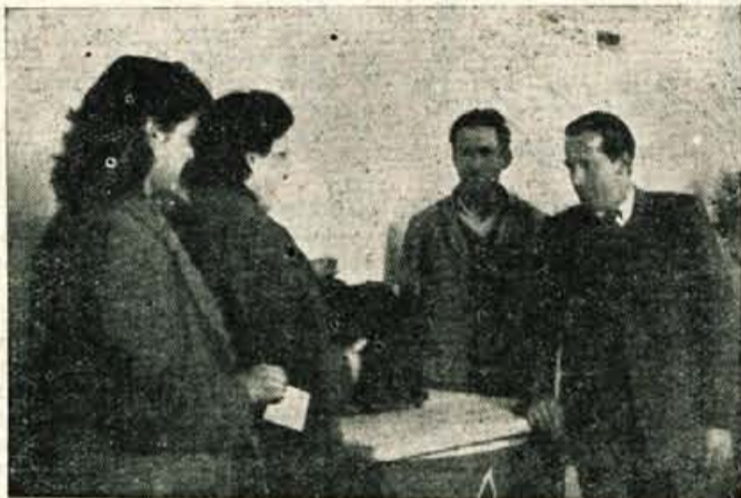
Med volitvami novega Delavskega sveta v »Industriji bombažnih izdelkov« Kranj

fukcij opravljajo žene in so jih menda prav zato morali »prikrasiti« pri volitvah v delavski svet. V »Iskrici« je bilo s anketo predlaganih 134 kandidatov za novi delavski svet, od tega 28 žena in 106 moških. Izvoljenih pa je bilo 110 kandidatov, od tega vseh 106 moških in le 4 žene. Da je izpadlo toliko žena je v glavnem kriva sindikalna organizacija, ki je premalo politično pripravila volitve, kajti pokazalo se je, da so se žene trudile, da bi uveljavile svoje kandidate, vendar so jim prav moški s svojimi napačnimi nazori o ženah prekrizali račune. (Več žena, ki so izpadle, je dobilo nad 1300 glasov!) Najslabše pa je bilo v tem pogledu v Gozdnem gospodarstvu Kranj, kjer v novem 18 članskem delavskem svetu ni nobene žene. Res, da je karakter podjetja tak, da prevladujejo moški, vendar bi se verjetno med 5 nameščencev, ki so prišli v nov delavski svet, le dalo uvrstiti tudi kakšno ženo.