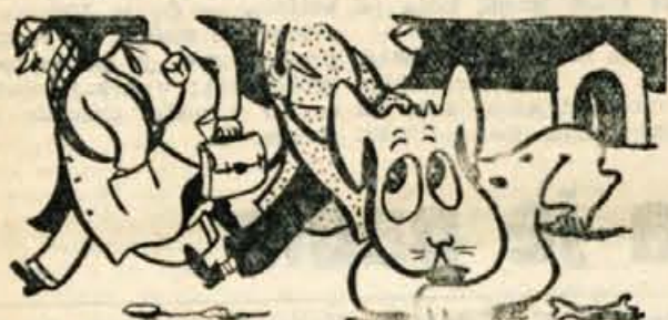
— Vi kar bežite čez, jaz pa sem pasjega življenja že tako in tako navajen... (Iz „Totege lista“)

Pred dnevi so vsi prebivalci neke vzhodno-nemške vasi pribežali v zahodni Berlin.