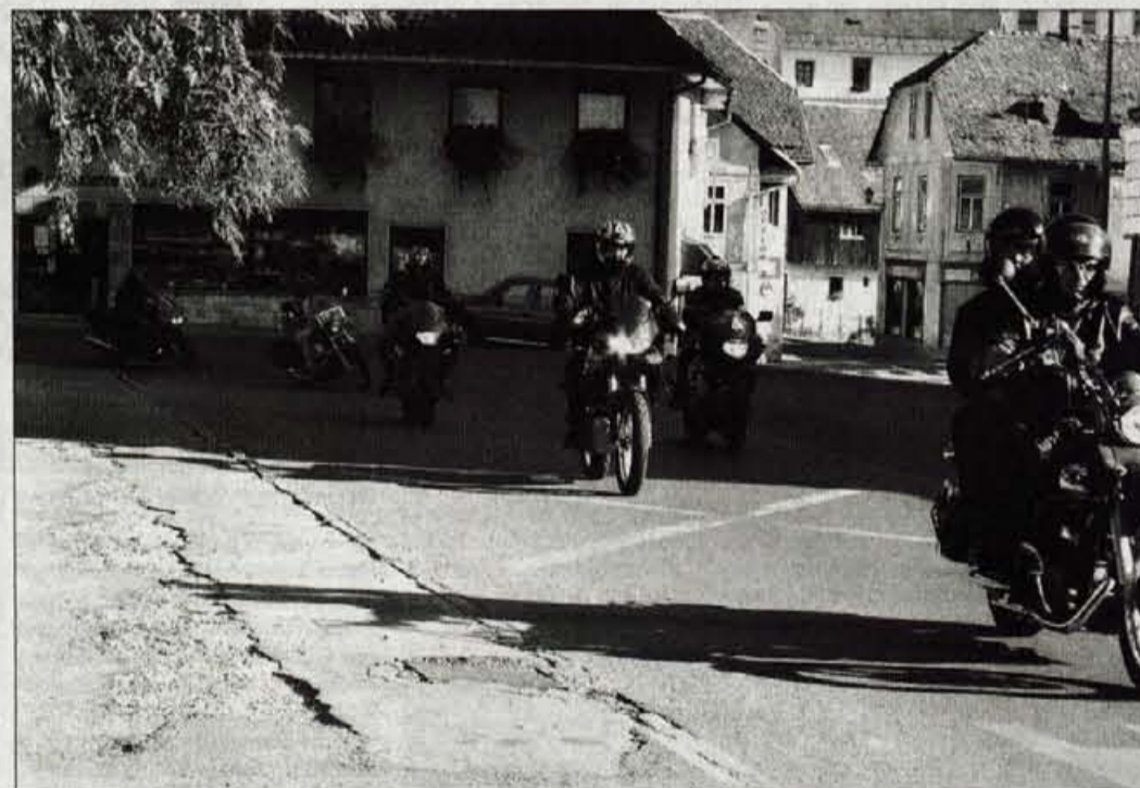
Vse več motoristov sede na motor iz užitka, ki pa ga lahko hitro pokvari prometna nesreča.

Drugo, nič manj pomembno opozorilo motoristom je, da ugotovijo kaj je z žrtvijo prometne nesreče, nato pa čimprej pokličejo pomoč (po telefonu 112 ali s pomočjo ostalih, ki pripeljejo ali pridejo mimo). Če se žrtev po nesreči ne odziva, je potrebno čimprej začeti z oživljanjem, pri čemer je treba poznati vsaj osnovne napotke tako imenovanega ABC oživljanja. Prav o tem kako in v kakšnih primerih začeti z oživljanjem, je bilo največ govora na predava-