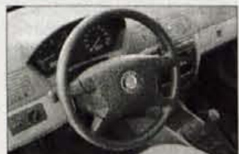
V notranosti je prostora toliko kot v večjem avtomobilu, armaturne plošča je germansko redoljubna.

★★★★★ Notranost: Kombijevska fabia je zaradi dobre notranje razporeditve eden najbolj prostornih avtomobilov svojem razredu, sedenje pa je skoraj in takšni ravni kot v skoraj dve številki večji octavii. Tudi prtljažniku razen nekaj centimetrov nakladalnega roba, ni kaj oporekati, saj s svojo prostornino prekaša večino avtomobilov v spodnjem srednjem in celo v srednjem razredu. Obdelava prtljažnega dna je temeljita, ob strani pa sta še dva dodatna predala za shranjevanje drobnarij. Voznikovo delovno mesto je urejeno po načelu racionalnosti, zato je na kakovostni plastiki armaturne plošče nekaj več praznine in marsikdo si želi bolj razgibanih oblik ali pestrejših barv. Toda vse kar potrebuje voznik je podrejeno germanskemu redoljubju, le neugledni številčnici obeh osrednjih merilnikov sta videti bolj "češki".