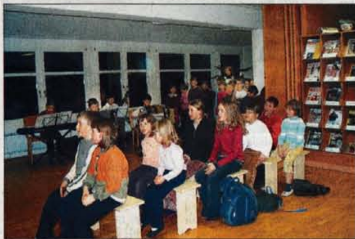
Nastop otrok iz osnovne šole Bohinjska Bela, ki praznuje letos petdeset letnico pouka in stoletnico šolske stavbe.