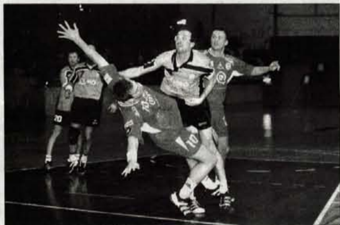
Loški rokometiški so znova namučili državne prvake.

Kranj - Tekme prvega spomladanskega kroga v rokometnih ligah so napovedale izenačeno prvenstvo tudi v nadaljevanju. To pomeni, da bodo rokometne dvorane še bolj polne. Gorenjski rokometni ligaši rezultatsko niso bili uspešni, zmagali so le rokometiški CHIO Kranja, s prikazanimi igrami pa tudi razočarali niso.