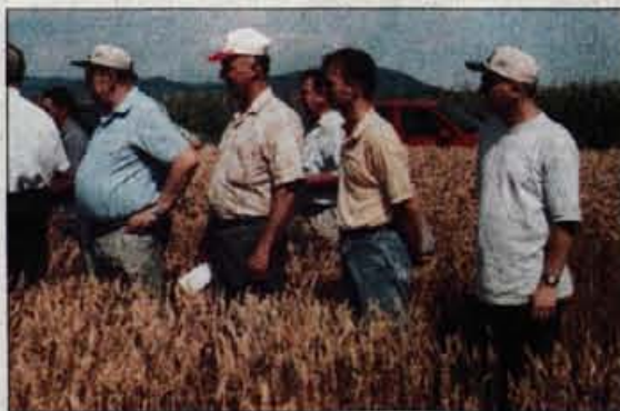
Gorenjski kmetje danes, včasih zadovoljni, dostikrat ne.

Ti nehvaležni kmetje! Tudi če jim gre dobro, se puntajo. "Loški podložniki mislijo, da bi ne moglo obstati loško gospostvo, ako bi se odpravila robotna, ker je treba na grad spravljati les, vodo, seno in slamo, popravljati mline in mostove, trebiti travnike in izvrševati še druga dela. A vendar želi škof osvoboditi za sedaj svoje podložnike robotanja proti temu, da mu plačujejo primerno robotnino. Ako bi pozneje kdaj postalo robotanje potrebno, delali bi podložniki zopet robotno, a robotnino ne bi plačevali več. Podložniki naj si nikar ne belijo glave s preišljevanjem, kdo bo popravil mostove in mline ter vozil les, vodo, seno in slamo na grad; ako bodo plačevali robotnino, ostanejo lahko celo leto doma pri svojih ljudeh. Gotovo bi bil marsikak kmet pripravljen plačevati po 3 ali 4 gl. na leto, da bi bil potem oproščen robotne."