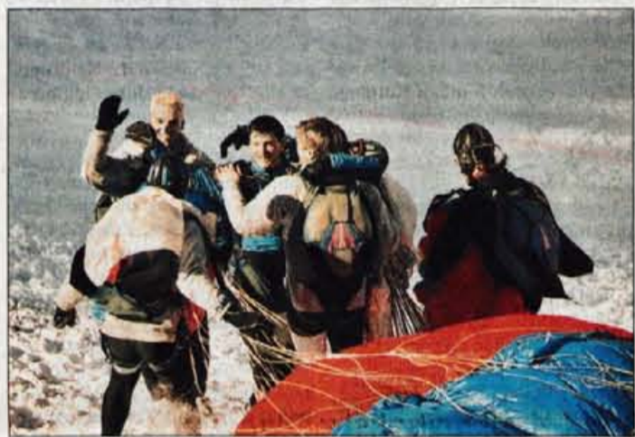
Slovenci so na Koblji zmagovali na svetovnem prvenstvu v paraskiju ekipno in posamezno. Veselje je bilo neizmerno.