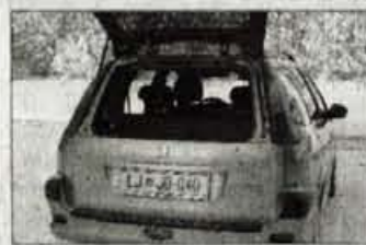
Prtljažnik: ločeno odpiranje steklenega dela, vendar skromna zmogljivost.

★★★★★ Motor: 1,4-litrski štiri-valjni je hkrati prožen in poskočen, zato je zlahka kos tudi teži tega kombija. Zvesto uboga ukaze s stopalko za plin in tudi polna obremenitev se mu ne pozna. Svoje delo oznanja dokaj glasno,