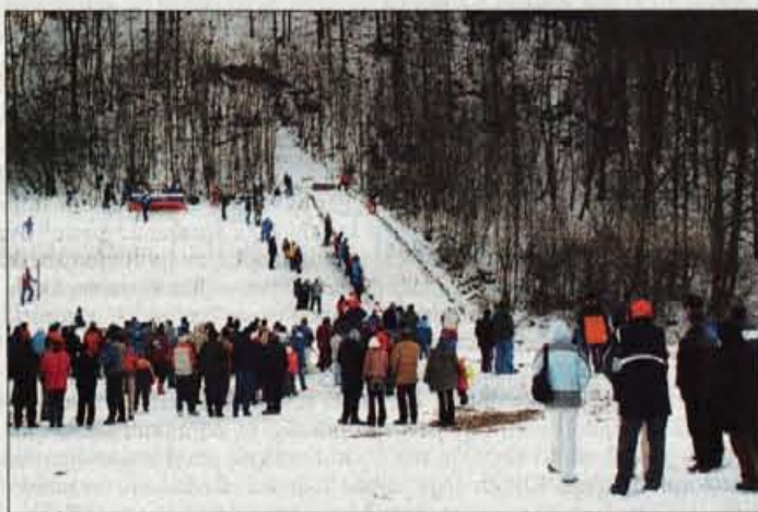
Uspelo je tudi tekmovalstvo ekip v smučarskih skokih.

Tokrat je bilo v Preski pri Medvodah ekipno tekmovalstvo v smučarskih skokih.