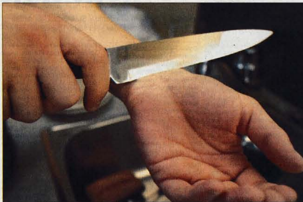
Slovenci spadamo med najbolj samomorilne narode v Evropi.

Opisani poskus samomora je torej doživel sodni epilog. Številni