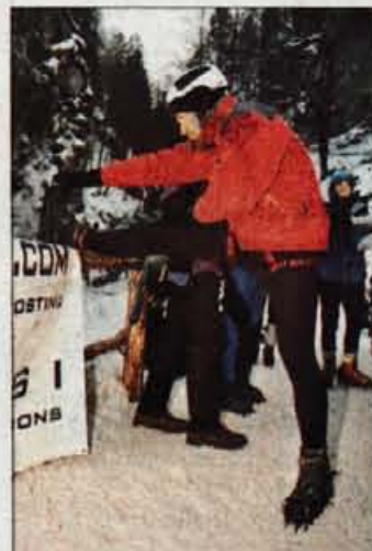
Pred tekmo se je treba ogreti...

Na Jesenicah je na svet prijokalo 11 novorojenčkov. 7 dečkom so se tokrat pridružile 4 deklice. Najtežji je bil deček, ki je tehtal 3.970 gramov, najlažji deklica pa je kazalec na tehtnici pokazal 2.960 gramov.