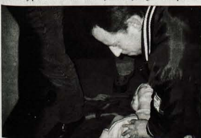
Udeleženci predavanja v Tacnu so lahko tudi v praksi preizkusili, kako ponesrečencu nuditi prvo pomoč.

Med vožnjo s sanmi po strmi in ledeni poti pa so Kroparju sani ušle s poti. Po petdesetih metrih so ga stisnile ob smrekovo deblo. Poškodbe so bile tako hude, da je na kraju nezgode umrl. H.J.