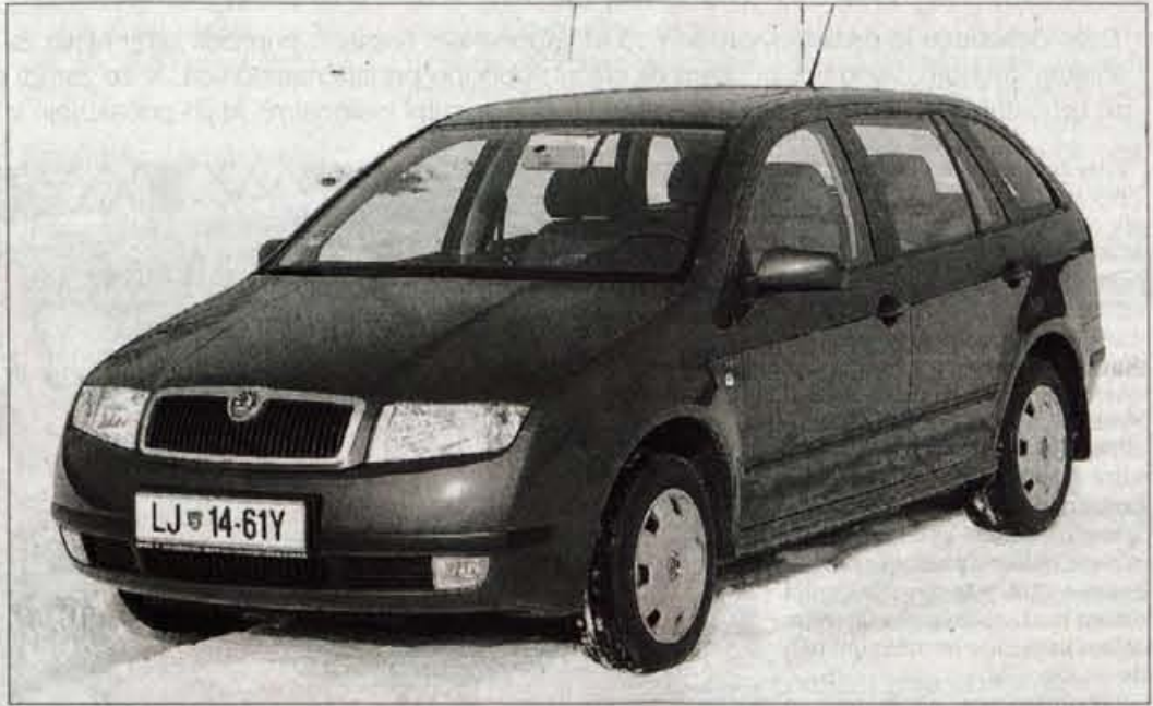
Škoda fabia combi je bila načrtovana že ob rojstvu kombilimuzine, češka tovarna pa ima s kombiji že kar precej izkušenj. Popolnejšemu videzu in uporabnosti bi koristili strešni prtljažni nosilci.

★★★★★ Končna ocena: peugeot 206 SW se trudi biti privlačen družinski kombi, kar s svojo zunanostjo nedvomno je, pri notranji prostorski razporeditvi in predvsem z ne pretirano izdatnim prtljažnikom pa mu še manjka zrelosti.