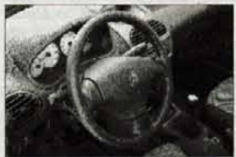
Notranost: privlačna oblika armaturne plošče, trda plastika in pomanjkanje prostora.

★★★★★ Zunanost: na novo ukrojen zadek pomeni kar občuten dolžinski prirastek, ki pa se dokaj dobro spaja s celotno karoserijo. Spremembe se začnejo z zadnjim parom vrat, ki so jim kljuko vdrali v motno črno plastiko in so na hitro komaj vidne. Posebnost so zadnje luči, ki na spodnjem robu segajo okoli vogala, zgoraj pa so nekoliko nedomiselnost