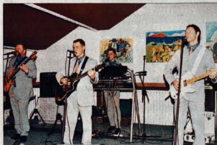
V restavraciji so zabavali popularni Čuki.