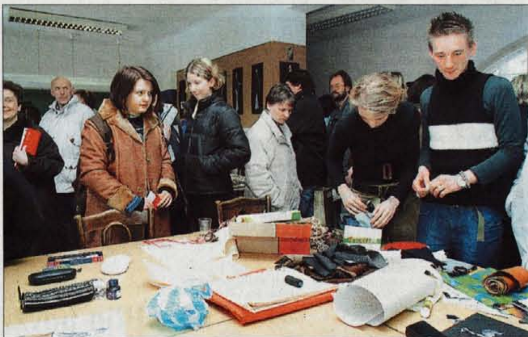
Veliko zanimanje za umetniške poklice.

nostjo. Navadno tudi še niso dovolj zreli, da bi si že pri petnajstih letih ustvarili pravo podobo svoje poklicne kariere. Takšne in podobne nejasnosti jim skušajo razbistri štolski svetovalci, s poklicno orientacijo pa se ukvarja tudi Zavod za zaposlovanje, navadno prek zunanjih izvajalcev. Na Gorenjskem to nalogo opravlja TIN Ljubljana, zavod za svetovanje in izobraževanje, ki program "Drugače o poklicih" namenja učencem 8. in 9. razredov osnovnih šol, dijakom zaključnih letnikov v srednjih šolah, študentom in brezposelnim. Mladi v manjših skupinah spoznavajo poklice v konkretnih delovnih okoljih, kar jim omogoči boljšo predstav o tem,