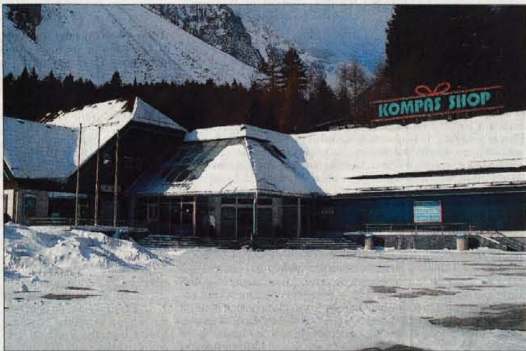
Parkirišče pred trgovino Kompas je prazno, v njej ni niti zaposlenih niti kupcev.

Povsem prazni sta tudi parkirišči pred trgovino in restavracijo Kompas. Pred slednjo stavbo so