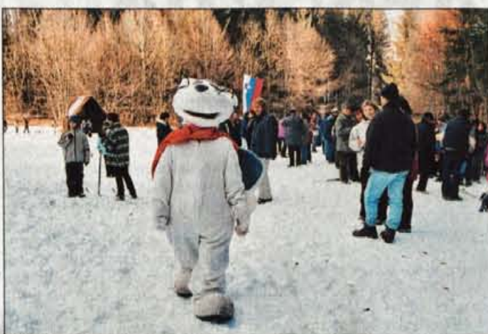
Brez zaščitnega znaka ali maskote na olimpiadah ne gre.

glede na devet kategorij devet, pri veleslalomu šestnajst in sankanju ravno tako šestnajst zmagovalcev oziroma zmagovalk. Tekmovali so tekmovalci zaselkov Blejska cesta, Dobje, Dolina, Jermanka, Ledina, Muže, Piškovca, Pod hribom, Polje, Rebr, Sebenje in Stagne. Na koncu so prehodni pokal olimpiade osvojili tekmovalci za-