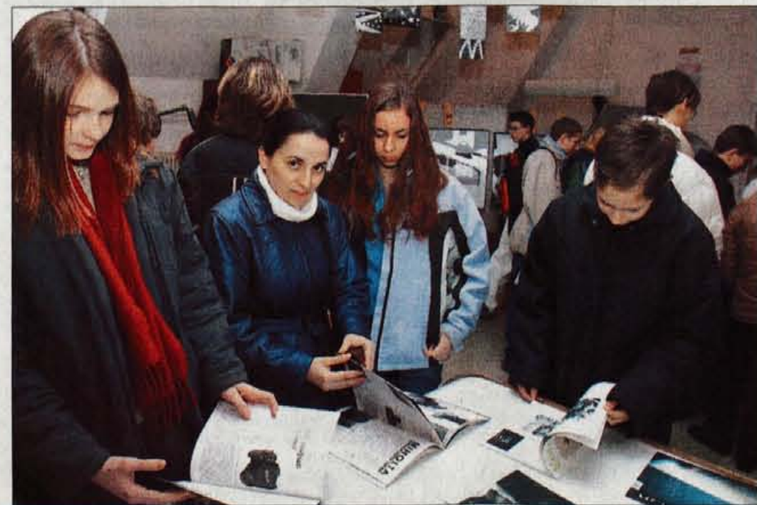
Gorenjci se zanimajo za šolanje na ljubljanski šoli za oblikovanje.

Danica Zavrl Žlebir, foto: Tina Dokl, Gorazd Kavčič