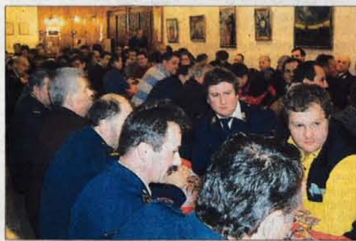
Udeležba mengeških gasilcev na občnih zborih je vedno dobra.

Na občnem zboru so podelili priznanja za dolgoletno delo. Tako sta dobila priznanje za 40-