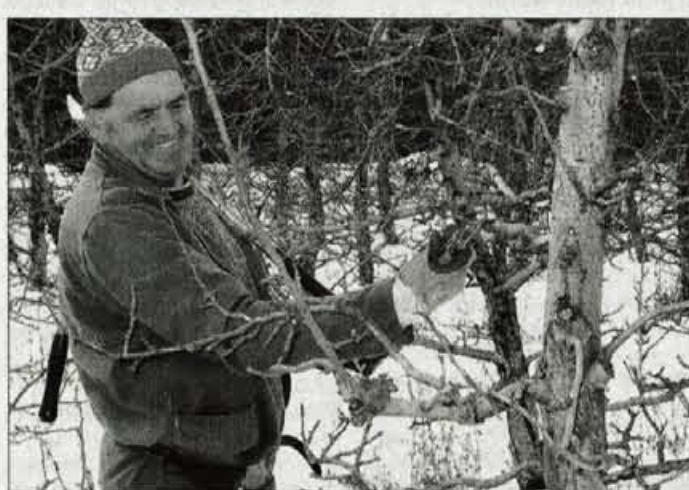
Med obrezovanjem sadnega drevja v nasadu Resje.

Odpornejše sorte, ki zahtevajo manj škropljenja, so ob vse