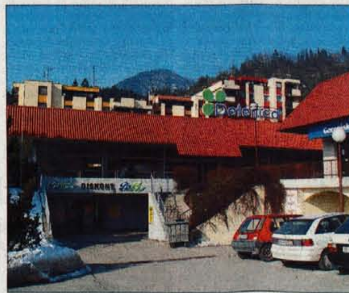
Kupce iz Avstrije in naše potnike pogrešajo tudi v Bistrici pri Trziču.