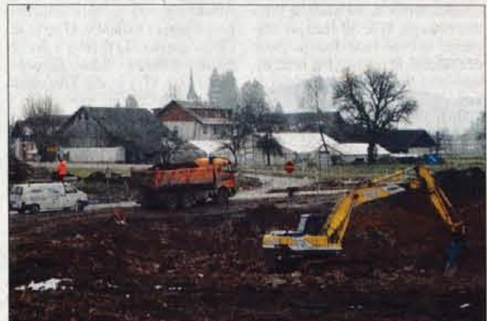
Med gradnjo razcepa Podtabor so se odločili za drugačno rešitev, ki ji nasprotujejo prebivalci Podbrezjij.

Kranj - Največja težava je predvidena sprememba razcepa Podtabor, ki ji domačini odločno nasprotujejo. Strokovnjaki Družbe za državne ceste ne nameravajo odstopiti od izgradnje povratne rampe, zato naj bi zaplet rešili z dopolnitvijo lokacijskega načrta. Druga naselja moti hrup z avtoceste.