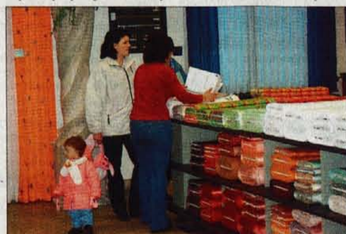
Prodajalna v TC Dolnov je edina Velanina prodajalna na Gorenjskem, kjer kupcem nudijo zaves v več kot 300 različnih vzorcih.