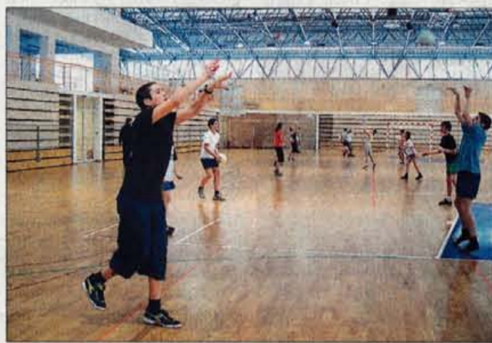
Dvorana je polno zasedena do zgodnjega popoldneva, ko so v njej šolarji, pozneje pa je na razpolago še dovolj prostih terminov za najem.