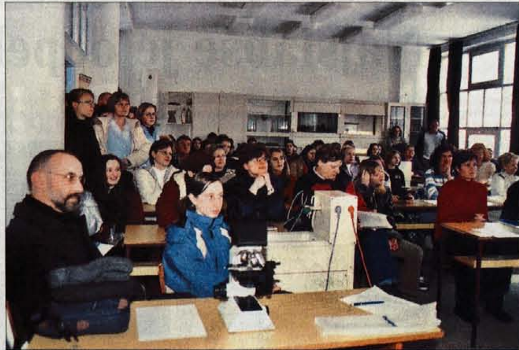
Na Jesenicah odslej tudi program predšolske vzgoje.

Z razpisom, ki so ga dobili letošnji osmošolci in devetošolci za srednje šole (in dijaki zaključnih letnikov srednjih šol za študij), so mlade dodobra seznanili s ponudbo za prihodnje šolsko (in študijsko) leto in z novostmi. Na Gorenjskem ni veliko novega: v Srednji šoli Jesenice so dobili nov program predšolske vzgoje, jeseniška gimnazija bo dobila tudi športni oddelk, Srednja elektro in strojna šola v Kranju izgublja izobraževanje za poklice v strojništvu, ki se selijo v škofjeloško