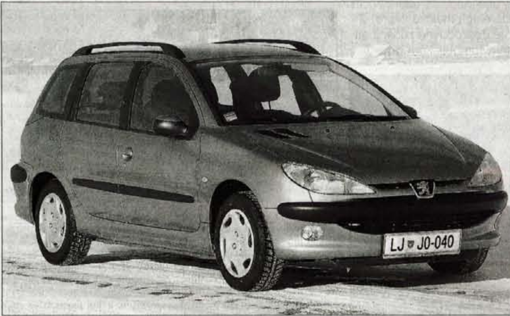
Peugeot 206 s kombijevsko karoserijo je logično, čeprav malce pozno nadaljevanje priljubljenega malčka. Kljub 19 - centimetrskega karoserijskega podaljšku, notranjega prostora ni v izobilju.

Tudi v razredu manjših avtomobilov so vse bolj v modi tisti, ki nosijo nahrbtnik in imajo v podaljšanem zadku dodaten prostor za prtljago. Zasedba v tej kategoriji sicer ni posebej velika, kljub temu pa konkurenčna tekma ni nič manj ostra. Kupcem se med najpogostejšimi vprašanji pojavlja predvsem eno: ali se odločiti za tisto, kar je privlačno na pogled ali drugo, ki prepričuje z merami. Takšno dilemo povzročata tudi peugeot 206 SW in škoda fabia combi.