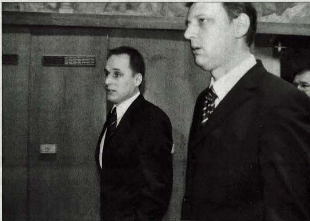
Novi predsednik Liberalne demokracije Slovenije mag. Anton Rop in dr. Slavko Gaber, eden od treh podpredsednikov stranke.

Liberalna demokracija Slovenije je v spremenjeni statut zapisala, da bo imela odslej tri podpredsednike, med katerimi mora biti ena ženska. Nekdanja županja Ljubljane Vika Potočnik zaradi dogodkov s Slovensko investicijsko banko (SIB) ni dala soglasja h kandidaturi za podpredsednico stranke. Kandidirali pa so državnozborni poslanci Jožef Školč , Majda Širca in Slavko Gaber