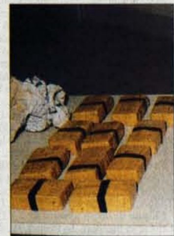
Zasegov drog je vsako leto več.

razširjene in katerih uporaba je nevarnejša. Ob tem podatku je pač ne moremo izogniti dejstvu, da ima Slovenija geostrateški položaj, saj leži na t.i. balkanski poti, po kateri poteka trgovina z drogami v smeri iz jugovzhodne Evrope v srednjo in zahodno