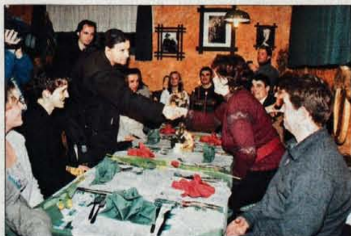
Goran Karan z nagrajenci v gostišču Pr'Matičku.