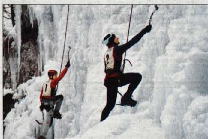
Tekma v lednem plezanju, ki je štela za slovenski pokal...

Črno goro nad Mojstrano in še kam, zgradil bivač, kot zagrizen ledni plezalec, ki je hotel kar s čevlji preplezati ledeni Peričnik. V Mlačci je že pred sedmimi leti začel delati slapove. Nad sotesko, ki jo je najprej skupaj s šolo in drugimi očistil - v njej je bilo za tri kamione odpadkov - je do 300 metrov oddaljeno vodno zajetje, iz katerega je s sodelavci potegnil vodo. Prva leta so bile le sveče, nato pa iz leta v leto več. Stene so zavarovali, cevi navrtali in dva-