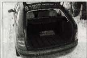
Prtljažnik: z nakladalnim robom, vendar s prostornino nad razrednimi običaji.

★★★★★ Zunanost: modne smernice so fabii combi naredile bolj zaobljen zadnji del kot se je za kombije spodobilo še pred nekaj leti. Vsako oko ima sicer svoje videnje estetike, toda ni malo tistih, ki pravijo, da je kombijev-