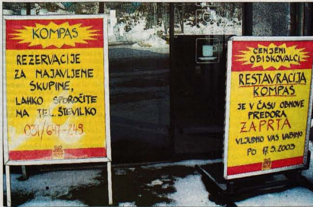
Pred restavracijo je v vlijudno povabilo, naj se gostje vrnejo marca.

GORENJSKI GLAS je registrirana blagovna in storitvena znamka pod št. 9771961 pri Uradu RS za intelektualno lastnino. Gorenjski glas je poltednik, izhaja ob torkih in petkih, v nakladi 22 tisoč izvodov. Redna priloga naročniških izvodov zadnji torek v mesecu je Gregor. Ustanovitelj in izdajatelj Gorenjski glas, d.o.o., Kranj / Direktorica: Marija Volčjak / Priprava za tisk: Media Art, Kranj / Tisk: SET, d.d., Ljubljana / Uredništvo, naročnine, oglasno trženje: Zoisova 1, Kranj, telefon: 04/201-42-00, telefaks: 04/201-42-13 / E-mail: info@g-glas.si / Mali oglasi: telefon: 04/201-42-47 sprejemamo neprekinjeno 24 ur dnevno na avtomatskem odzivniku; uradne ure: vsak dan od 7. do 17. ure. Naročnina: za prvo trimesečje 2003 znaša 5.930 tolarjev, posamezniki redni plačniki imajo 20-odstotni popust in zanje trimesečna naročnina znaša 4.744 tolarjev. Letna naročnina znaša 24.080 tolarjev, posamezniki - redni plačniki imajo 25-odstotni popust in zanje letna naročnina znaša 18.060 tolarjev. V ceni je vračunan DDV. Naročnina se upošteva od tekoče številke časopisa do PISNEGA preklica; odpovedi veljajo od začetka naslednjega obračunskega obdobja. Za tujino: letna naročnina 100 evrov. Oglasne storitve: po ceniku. DDV po stopnji 8,5% v ceni časopisa / CENA IZVODA: 180 SIT (14 HRK za prodajo na Hrvaškem).