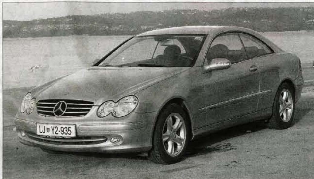
Mercedes-Benz CLK je športno elegantni kupe za tiste, ki si lahko privoščijo statusni simbol visoke (predvsem cenovne) kategorije.

ljivimi, grafično prijetnimi in dobo osvetljenimi merilniki, z logično razporejenimi stikali in z ravno pravšnje količino obvladljive elektronike vozniku ponuja partnerstvo za nezapleteno upravljanje. Pod poglavje elektronika sodi tudi podajalnik varnostnega pasu, po katerega se ni treba stegovati daleč nazaj, ampak se vse zgodi samodejno ob zasuku kontaktnega ključa. In vse skupaj je