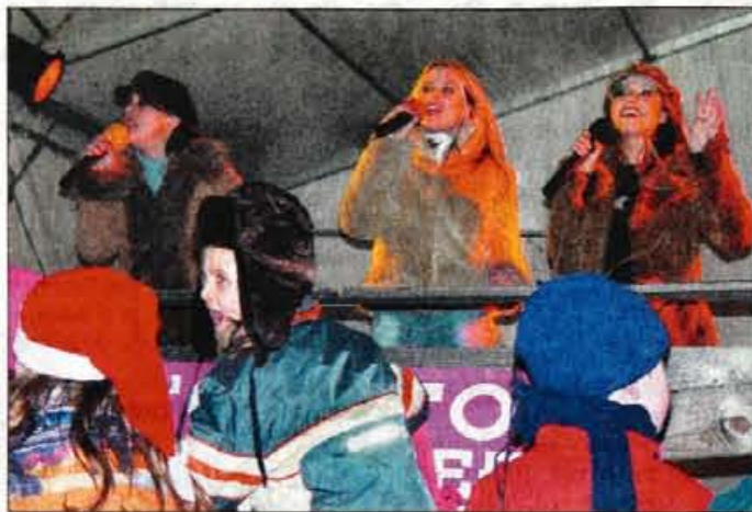
Vesela in poskočna dekleta iz skupine Foxy teens so pregnala mraz.

Kljub klavnim snežnim razmeram pa je bilo minuli konce tedna v Kranjski Gori veselo in zanimivo. LTO je pripravil vesel in zanimiv program, ki se je začel na trgu pred Turistično informacijskim centrom že v petek z tekmo-