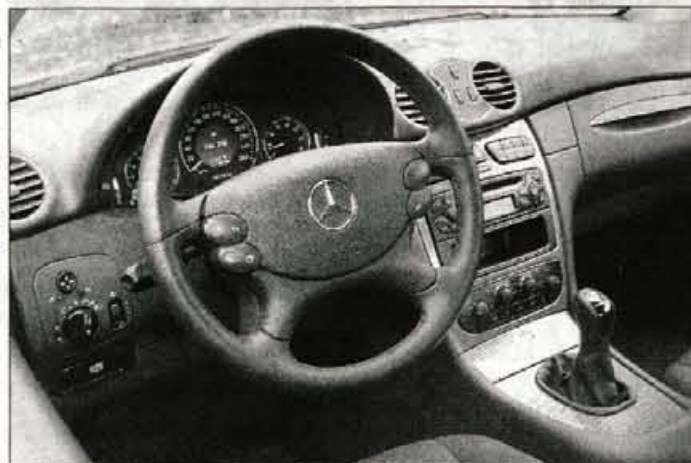
Filigransko delo: urejena in s temeljitimi materiali obdelana notranjost, tako kot je tipično za novejša mercedese.

v sebi združujejo zadržano športnost in razkošno eleganco. Prve CLK premore malo manj in drugega malo več; sprednji del je z ledvičastima žarometoma bolj podoben večji limuzini razreda E in manj manjšemu razredu C, čeprav ima z njim več skupnih tehničnih točk. Pogled na sprednji del razkriva dolg, k tlom potisnjen nos, ki se nadaljuje v gibkih bočnih linijah in elipsasto ukrivljeni strehi ter konča v zadku, ki deluje vse prej kot športno. Pripadnost hišni kupejevski brigadi dokazuje z veliko trikrako zvezdo, ki pri stuttgartskih športnikih ne štrli iz motornega pokrova, ampak je vdolbena v masko hladilnika, imenitnost pa s karoserijsko zasnovano brez sredinskega strešnega stebrička, kar je nedvomno svojevrstna posebnost.