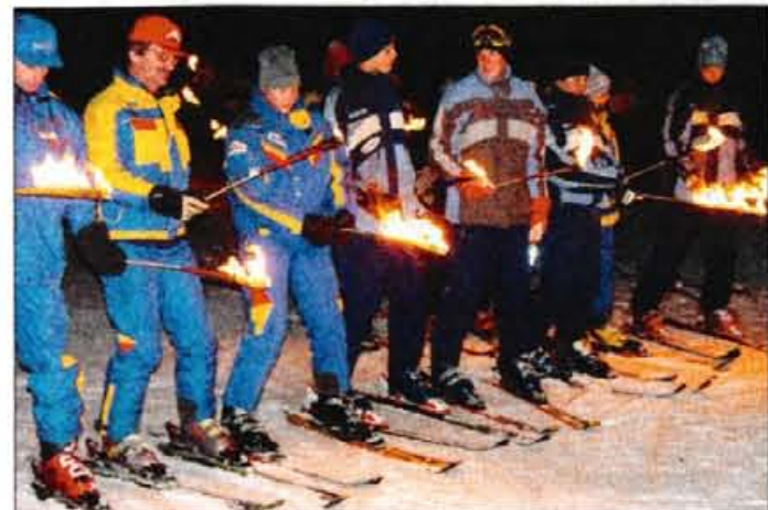
Baklada članov Alpskega smučarskega kluba Kranjska Gora.

Izgled novih bazenskih prostorov s savnami in tuši je res zanimiv. Nič preveč bahav, pa vseeno prijeten. Večinoma so in bodo lahko koristili hotelske storitve predvsem njihovi gostje, ne bodo pa vrat zaprli posameznikom, ki bi jih pot v Kranjsko Goro. Alenka Brun