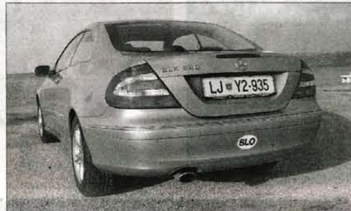
Zadek je manj izrazit del zunanosti, vtis bi bilo mogoče popraviti z majhnimi triki, na primer z dvojnim zaključkom izpušne cevi.

CLK je zdaj daljši, širši in višji, z večjo razdaljo med kolesi, kot jo imel njegov predhodnik in to