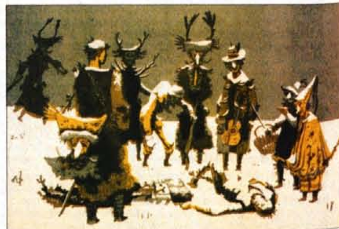
Mrtvi kurent, 1954, barvni lesorez