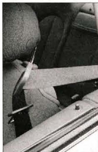
Uporabniško prijazno: varnostni pas do voznikovih rok "pripele" samodejni podajalnik.

"zapakirano" v prvovrstne materiale najsi gre za plastiko armaturne plošče, sedežno oblažino ali obloge vrat. Tisti, ki si od