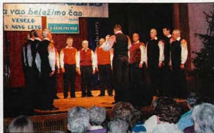
Moški pevski zbor Oton Župančič Sora.

Na prvi prireditvi Veselo v novo leto so domačini predstavili bogato kulturno dejavnost, mi pa smo poskrbeli za veselo razpoloženje.