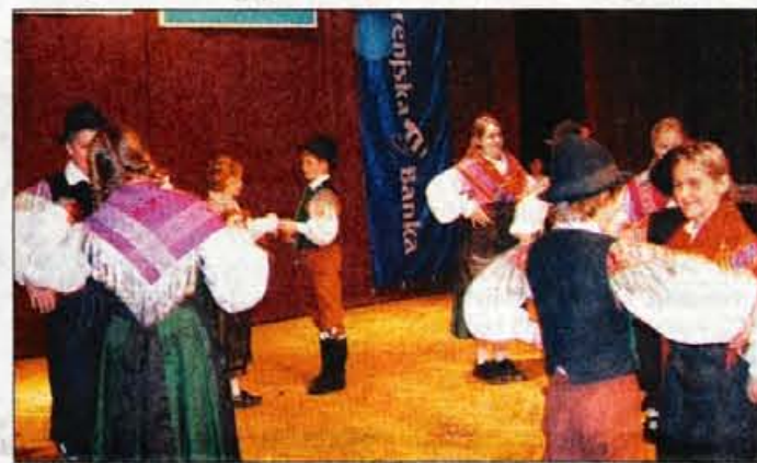
Zaplesali so tudi najmlajši člani folklorne skupine.

V Vodicah pa bo prireditev Veselo v novo leto v dvorani Kul-