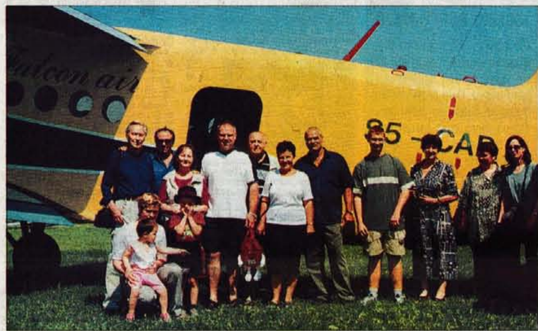
Gregorjevi nagrajenci pred letalom družbe Falcon Air/Sokolje gnezdo iz Radovljice.

izzrebancev. Nekateri so se sicer izgovarjali, da niso bili izžrebani, vendar smo kaj kmalu ugotovili, da oklevajo, ker jih je malce strah letenja.