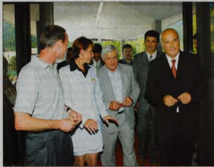
Predsednik države Milan Kučan je slavnostno prerezal otvoritveni trak.

Poleg nove kategorizacije štirih zvezdic je pridobil tudi tri nove programske produkte: vodni park, masažni center ter konferenčni center. Tako je postal hotelsko turistični center z najbolj pestro in edinstveno ponudbo na področju Julijskih Alp. S to investicijo je tudi uspešno zaključena