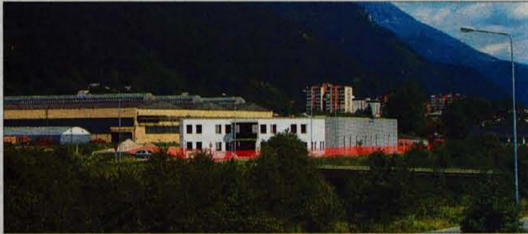
V nov skladiščno servisni objekt na Jesenicah se bodo preselili septembra.

Kranj - V Sloveniji je 25 višjih strokovnih šol, od tega 8 zasebnih, s 16 različnimi programi. Dujaki lahko šolanje nadaljujejo na višjih strokovnih šolah strojne, kmetijske, živilske, turistične, gostinske, gradbene, komunalne, elektro, lesarske, komercialne, prometne in še nekaterih smeri, od tega je na Gorenjskem le Višja strokovna šola za gostinstvo in turizem Bled, ostale pa so v Mariboru, Novem mestu, Celju, Velenju, Murski Soboti, Brežicah in v Slovenj Gradcu. Omenjene šole zapolnjujejo prostor med srednjimi in visokimi strokovnimi šolami, šolanje pa traja dve leti. Poleg teoretičnega znanja njihovi izobraževalni programi nudijo študentom tudi veliko praktičnega dela, približno 40 odstotkov celotnega programa. Od prvega vpisa pred šestimi leti se je število višjih strokovnih šol precej povečalo, v vseh slovenskih strokovnih šolah je bilo letos na voljo več kot 4500 vpisanih mest. Pogoj za vpis na višjo strokovno šolo so opravljena matura, zaključni izpit ali poklicna matura na štiri letni srednji šoli, vpišejo se lahko tudi tisti, ki so končali poklicno srednjo šolo in imajo tri leta delovnih izkušenj, osebe z delovodskim izpustom, poslovođe in mojstri s pridobljeno mojstrsko diplomino, ki so zadnja leta čedalje bolj motivirani za strokovno izobraževanje. R. Š.