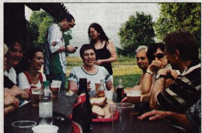
Na Glasov piknik jih je prišlo veliko in imeli smo se dobro.

Zgodnje jutranje ure so napovedovale vroč poletni dan. Na leškem letališču je bilo živahno že navsezgodaj. Ker letališka restavracija še ni bila odprta, smo našim