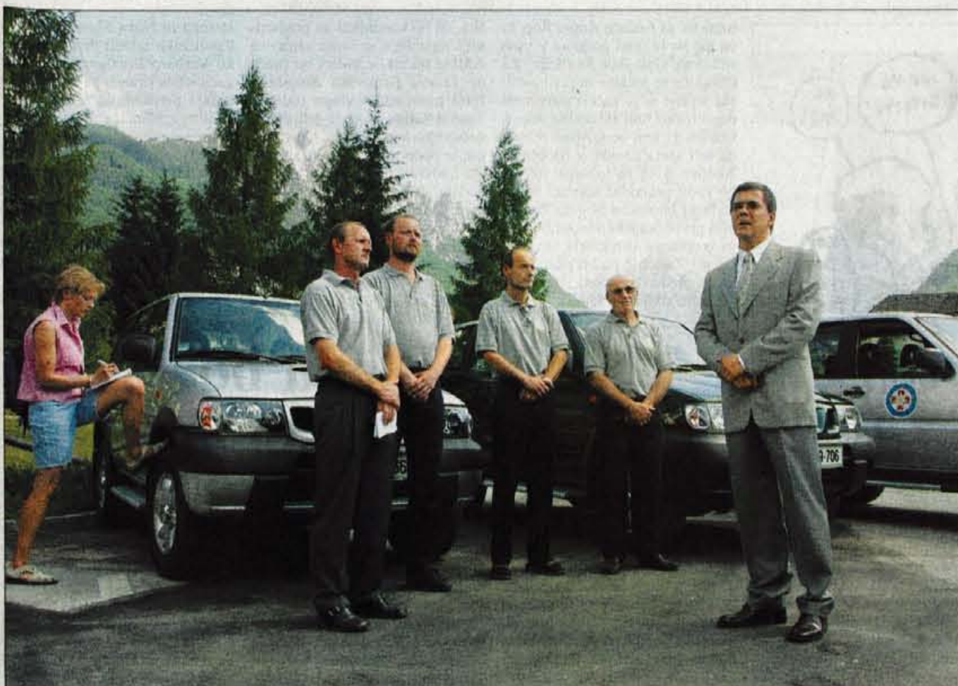
Ob jubileju GRS so nova vozila dobile postaje Bovec, Bohinj in Mojstrana.