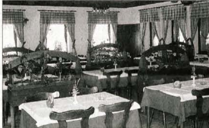
Restavracija ima 170 sedežev.

Z izbiro nastavitve '3 v 1' pomivalni stroj aktivira poseben način pomivanja; tableta se do konca raztopi, rezultati sušenja so boljši, ker se sredstvo za sijaj sprosti šele ob zadnjem vročem izpiranju posode, za boljši izkoristek encimov v pomivalnem stroju stroj izbere najugodnejšo temperaturo vode, slednji pa je opremljen tudi s posebej prilagojenim predalom za tablete. Electrolux