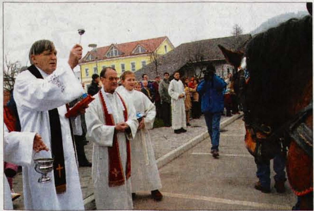
Žegnanje konj v Stražišču.

Kranj - Včeraj je bilo Štefanovo, zelo spoštovan verski in ljudski praznik. Na večerajšnji dan so v številnih gorenjskih krajih v spomin na Štefana, prvega krščan-