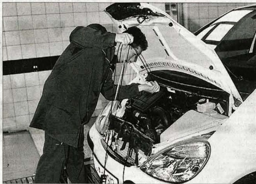
Kontrola temperature motornega olja.

"Če sedaj ugotovimo previsoko vrednost ogljikovega monoksida, vznikna napotimo k serviserju, kjer še enkrat opravijo meritve in poiščejo napako. Navadno morajo zamenjati lambda sondo, se pa zgodi, da tudi cel katalizator. Do sedaj smo kontrolirali vsebnost izpušnih plinov pri okoli 150 avtomobilih in pri slabih tretjini smo ugotovili napako," pojasnjuje Sajovic. Ob tem je potrebno dodati, da večina servisov sploh še ni opremljena z ustrežno opremo za merjenje izpušnih plinov, vsaj tako smo obveščeni. Po naših podatkih sodobni merilnik izpušnih