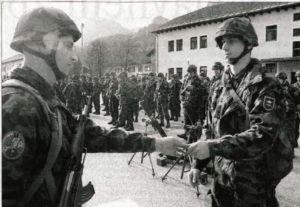
Na postroju so posameznim pogodbenim rezervistom podelili tudi kovanec Slovenske vojske.

set let (častnik), ima najmanj srednjo poklicno šolo (vojak), srednjo ali višjo šolo (podčastnik) oziroma najmanj visoko strokovno šolo (častnik), ima opravljen tečaj za poveljnika oddelka vojnih enot ali podčastniški čin - če kandidira za dolžnost podčastnika, ima končano ŠRO oziroma ŠCVE