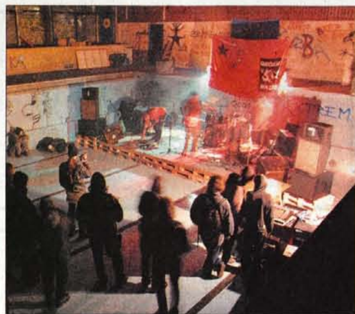
Bazenska intima brez ogrevane vode

Priznam. Tudi sam sem bil presenečen, ko sva se pretekli petek s fotografom Gorazdom odpravila na "izbruhovo osvobojeno ozemlje". Nikjer nobenih policajev. Sicer pa, zakaj bi bili. Od daleč ni izgledalo, da se v bazenu kaj dogaja. Nekaj folkla si je pred vhom prijetno grelo ob sodu z ognjem, v dvorani oziroma na koncu od vode izpraznjene bazena pa je v soju nekaj reflektorjev odmevala muzika. Na hitro rečeno, precej "noise" varianta. Na drugem koncu bazena je deloval neke vrste klubski šank. Zgoraj, na steni ob robu bazena razstava na temo Tita, ex Jugoslavije... Glede na to, da v objektu ni ogrevanja in elektrike (v uporabi je ponavadi izposojeni agregat), je na rahlo, precej intimno osvetljenem prizorišču zeblo kot prasica. Kot je povedal Šulc, bazen obratuje le ob večjih dogodkih ali festivalih, sicer pa se ponavadi dogaja v prostorih, kjer so bile nekoč bazenske garderobe, pisarna, reševalna soba... Ogle? O.K. Prva soba je spalnica, v njej so se tokrat namestili člani nastopajočih skupin, ogreva pa majhen "gašperček", sledila je tokrat zatemnjena kuhinja, pa prostor, sicer namenjen koncertom, v katerem so tokrat prijatelji iz ljubljane-