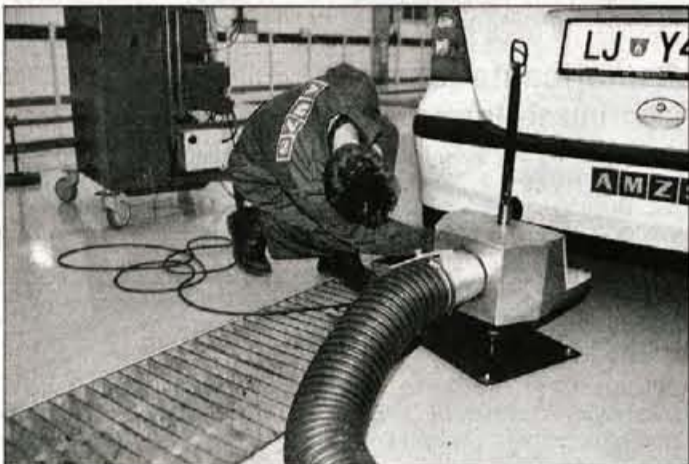
Priprave avtomobila na meritve izpušnih plinov.

Kranj - S 1. decembrom letos so začele pooblaščen organizacije za izvajanje tehničnih pregledov motornih in priklopnih vozil na tehničnih pregledih poskusno meriti emisije izpušnih plinov. Spremembe Pravilnika o tehničnih pregledih motornih in priklopnih vozil namreč narekujejo, da bodo na tehničnih pregledih po 1. decembru leta 2003 začeli v celoti ocenjevati ekološko sprejemljivost vozil, kakor predpisuje direktiva Evropske unije in je tudi ena od obveznosti, ki jih mora Slovenija urediti do vstopa v Evropsko unijo, so sporočili iz Sekcije izvajalcev tehničnih pregledov motornih vozil pri Združenju za promet in zveze v Gospodarski zbornici Slovenije.