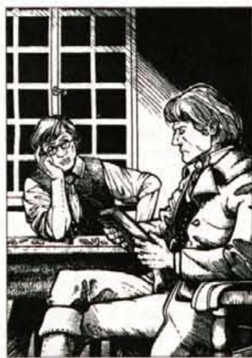
Kersnikove Kmetijske slike, ilustracija Uroša Hrovata, izdala založba Karantanija, 1995

izraz Kersnikove skrbi za slovensko meščanstvo, ki je duhovno in moralno nagnito (Slodnjak), zgodba o moralni mizeriji uradništva, propadajočega v duševnem brezdelju (Grafenauer), slika življenja in miselnosti naše podeželske inteligence (Ocvirk), kritika podeželskega izobraženstva (Kos), realistično hladen in neprijeten opis trške gospode (Kolšek), 'podoba zelo povprečne trške gospode, njene plitkosti in duševne lenobe', gospode, ki ne kaže smisla za resnične človeške vrednote (Janež), 'notranja podoba našega malomeščanstva' (Gregorač), slika meščanske nemorale, površnosti in lahkomišelnosti slovenskega meščanstva v erotičnih rečeh (Tomažević). Bralec iz Jare gospode res veliko izve o uradniškem vsakdanu in o samskem življenju slovenske gospode, ki se zaradi ob podatku, da je imel adjunkt Pavel vse svoje reči v enem samem kovčku, z današnjega stališča precej turobno, če pa presojamo reči v njihovi go-