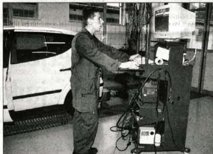
Celoten proces je računalniško podprt.

Bled - Blejski policisti so v ponedeljek nekaj pred polnočjo ob kontroli prometa nameravali ustaviti 50-letnega voznika osebnega vozila B.D. z Jesenic, a je ta njihove znake "spregledal". No, policisti so se podvzeli za njim in ga kaj hitro vendarle ustavili. Ker je kazal znake vinjenosti, so mu odredili preizkus alkoholiziranosti, vendar ga je Jeseničan zavrnil. Še več, kljub prepovedi se je odpeljal naprej. Policistom tako ni preostalo drugega, kot da ga znova ustavijo in ga pridržijo do iztreznitve. Le na takšen način je patrulja lahko zagotovila, da voznik ne bi še naprej kršil prometnih predpisov, so v sporočilu za medije še zapisali na Policijski upravi Kranj. S.S.