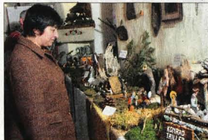
V Jalnovi hiši na Rodinah je na ogled 55 jaslic iz vse države - starih in novih, iz različnih materialov.