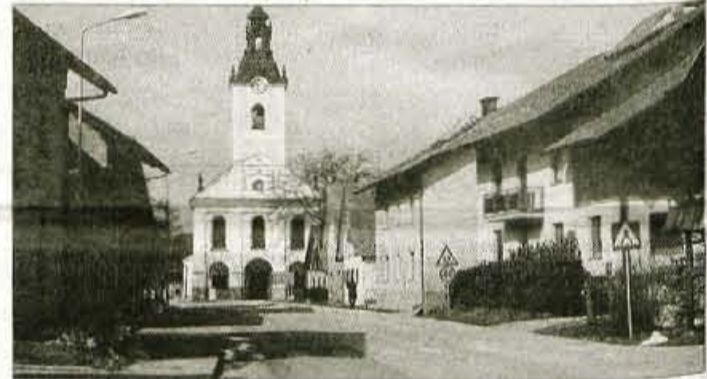
Cesta skozi vas ni le asfaltirana, pač pa opremljena tudi s pločniki.