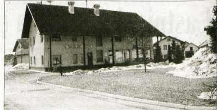
Sredi vasi ni več lokve, po kateri Voklo nosi ime, pač pa zgradba z gasilnim domom in trgovino.