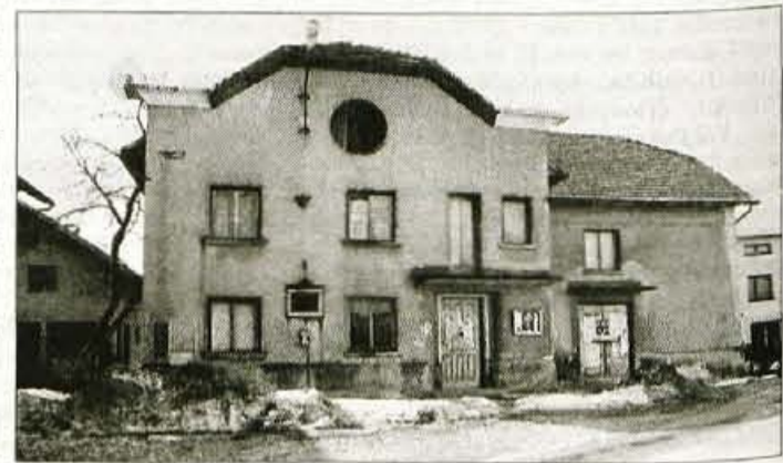
Ob lepo urejeni cerkvi svetega Jerneja manj lepa podoba kulturno-prosvetnega doma. Bo še kdaj namenjen kulturi?