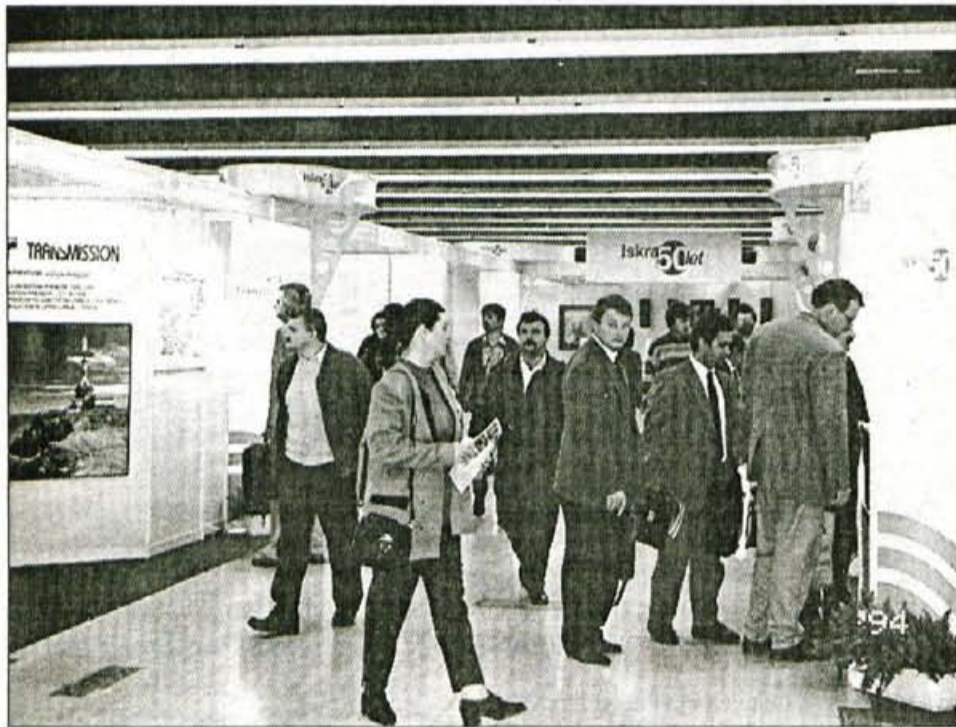
Podjetja, ki so ostala v Iskri, so se na sejmu elektrone predstavila skupaj.

Proizvodne programe želijo v prihodnje kompletirati s tujimi partnerji, seveda predvsem z izdelki, ki niso več v sklopu Iskre,