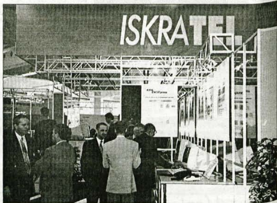
Iskratel predstavlja niz novosti, za široke množice bodo verjetno kmalu najbolj zanimivi na DECT priključeni prenosni telefoni, s katerimi bo moč telefonirati po običajni ceni.

V Iskratelu ima domači trg tretjinski delež, veliko izvažajo v Vzhod, kjer se seveda srečujejo z velikimi tveganjem, 90-odstotno so ga doslej nosili sami. V prihodnje si obetajo večje sodelovanje Slovenske izvozne družbe, ki naj bi začela kreditirati njihove kupce v tujini, predvsem v Rusiji. • M. Volčjak