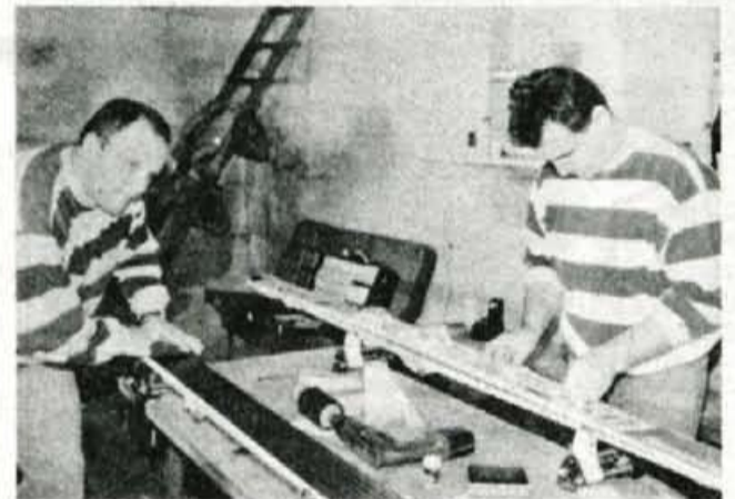
Novi predpisi o dolžini in montaži vezi na skakalnih smučeh so mariskomu zagrenili začetek sezone, naši serviserji pa so se tokrat v Planici izkazali z odlično pripravo in zanesljivo (na milimetre natančno) montažo.

Čeprav je začetek sezone vedno "tipanje" forme in so