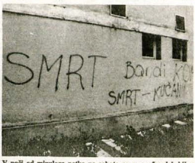
V noči od minulega petka na soboto so se na fasadah hiš v Tržiču in na nadvozu na Deteljici pojavili napisi Janša, Janša. Največji pa je bil na fasadi hiše na tržiški tržnici...