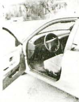
Notranjost: nova in nevpadljiva

novega in nič pretresljivega. V ta okvir sodi seveda nova armaturna plošča, na kateri je kot ponavadi vse kar vozniku predstavlja osnovo za svoje delo, skupaj z dodatki, ki mu vožnjo olajšujejo. Sem štejem elektrificirana stekla v vseh štirih vratih, ki jih lahko upravlja vsak potnik posebej ali pa voznik, pa s pomočjo elektrike nastavljivi bočni ogledali in vzvoda za notranje odpiranje dveh pokrovov, prtljažnega in tistega, ki zapira posodo za gorivo. Vse skupaj pa je že tradicionalno pregledno in priročno, pa tudi že malce hyundaijsko stilistično. Edina kritika gre pravzaprav volanskemu obroču, ki je za lahkotno