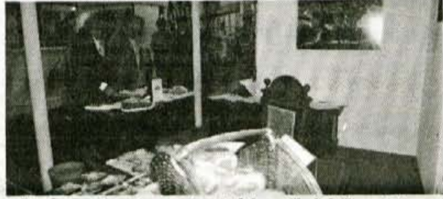
Posebno zanimanje na sejmu je bilo za škofjeloško stojnico, na kateri se je tisočletno mesto predstavljalo kot "galerija v naravi." Obiskovalcem pa so predstavljali tudi nov propekt in video kaseto z zanimivostmi škofjeloške občine.

ner. Letos pa bodo z novimi prometnimi povezavami poskrbeli, da se bo turistično življenje začelo tudi v južni Dalmaciji. Tako so pred letošnjo turistično sezono vložili 5 milijonov mark