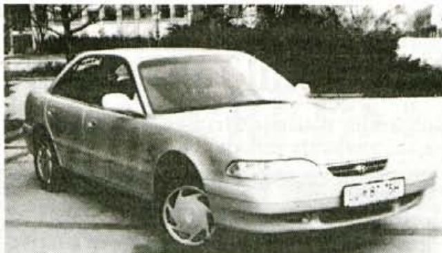
Hyundai sonata, tretjič: temeljita prenova

Para bočnih vrat sta po novem lepša in na račun varnostnih dodatkov skritih pod notranjimi oblogami tudi znatno masivnejša in težja. Notran-