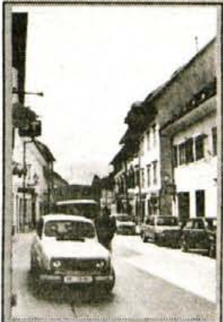
Parkirana vozila sredi trga - premalo prostora za pešce

M Mercator Preskrba Mercator TRGOVINSKO PODJETJE TRŽIČ d.d.