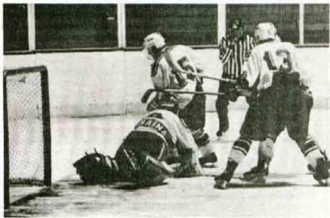
Naši mladi hokejisti so v tekmi za tretje mesto zaigrali borbeno in zaslužen premagali ekipo Ukrajine.