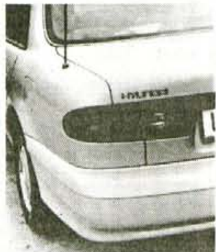
Zadek: zaobljena harmonija

Tokrat je bila prenova temeljita in že na zunaj tolikšna, da si je avtomobil vredno podrobneje ogledati. Povsem spremenjen je sprednji del, kjer sta nova žarometna in maska hladilnika, med plastičnimi deli pa še odbijač, kovinski pokrov motorja in seveda oba blatnika. Bočne linije so zdaj povsem po japonskem vzoru zaobljene, kar je seveda v prid boljši aerodinamiki in seveda tudi očem. In ker vsak avto najprej sodijo oči, si je treba zapomniti tudi sonatin zadek, ki je vse od kupolasto zaključene strehe do zadnjega odbijača daleč od tistega, kar je bila sonata nekoč in zelo blizu tistega, kar je recimo novi