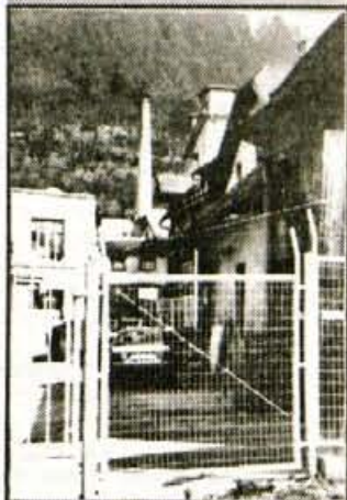
Pekov obrat PUR - tovarna, ki ne sodi v mestno jedro