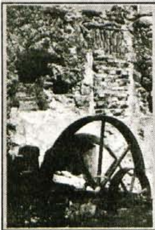
Lončarjeva elektrarna - propadajoči tehnični spomenik