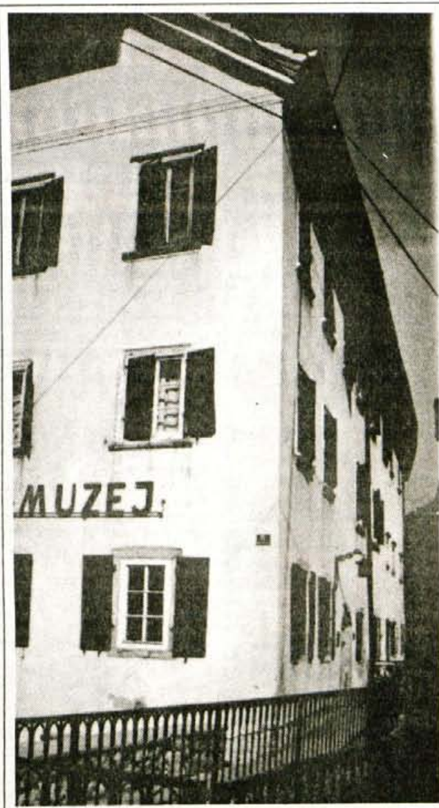
Tržiški muzej - le pol zakrpane strehe

"Velika praznina je nastala, ko smo z uvedbo usmerjenega izobraževanja izgubili v Tržiču možnosti šolanja odraslih za ekonomske in administrativne poklice. Delavska univerza pa je sledila potrebam tovarn pri pridobivanju kvalifikacij za posamezne tehnične poklice. Kot ena prvih je trziška univerza uvedla tudi usposabljanje za življenjsko uspešnost, ki je nekakšna opora ljudem brez zaposlitve. Ker izobraževanje postaja vse večja potreba, bo treba še naprej slediti željam ljudi za pridobivanje novih znanj; na primer, sedaj so aktualne priprave za strokovne izpite trgovske stroke. Žal je trziško zaledje tako majhno, da je pri organiziranju in izvedbi določenih programov nujno povezovanje z drugimi univerzami.