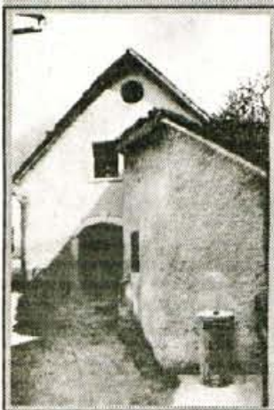
Germovka - bodo v njej še pela kovaška kladiva?