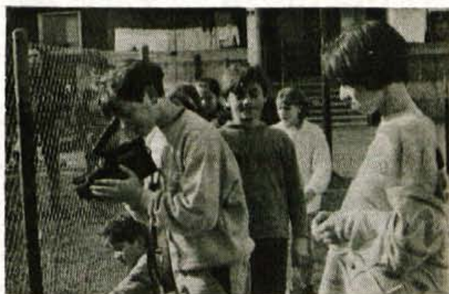
Gregor je opazil nekaj zanimivega izza ograje...

"Na začetku smo spoznavali predvsem značilnosti in zmožnosti posamezne tehnike ter se lotili teoretičnih osnov fotografiranja in snemanja. Temu je sledilo praktično delo s kamero. Sproti si na šolskem televizorju ogledujemo narejene posnetke, se pogovarjamo o napakah in snujemo nove zamisli za snemanje. Snemamo različne motive, od nastopanja učencev do pogovorov med njimi. Doslej je za nami približno 50 ur druženja ob kameri, med katerim so mladi pokazali kar precej ustvarjalnosti. Med zanimivejša snemanja v prostoru lahko uvrstimo posnetek nastopa ene od tečajnic, ki se ukvarja z jazz-baletom, prav veliko veselja pa so imeli otroci med prvim letošnjim snemanjem v naravi," je zadovoljen tudi njihov mentor.