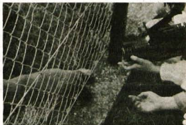
...glej, to je naš prijatelj, psiček Džeki!

Del tega ustvarjalnega veselja izražajo mentorjeve fotografije, s katerimi ohranja spomin na svoje tečajnike. Najbrž jih bo nastalo še precej do konca tečaja ob izteku letošnjega šolskega leta. • Stojan Saje