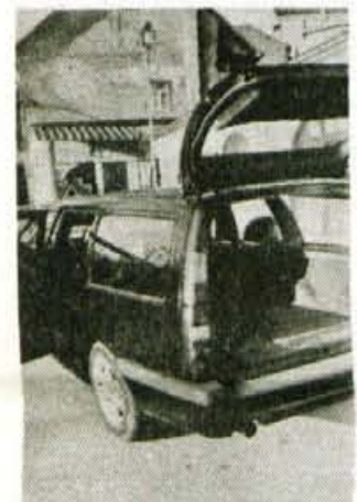
Kombijeovski zadek: luči do strehe in veliko prostora

Udobja je ne glede na to, kje sedi, za vsakega potnika dovolj. Prednja sedeža sta čvrsta in dobro oprijemljiva, oba pa sta tudi višinsko nastavljiva. Prtljažni prostor je (razumljivo) že sam po sebi velik, ob preklopljivi zadnji klopi pa nastane iz njega uporaben kombijeovski prostor, v katerega je še ob preklopljenem naslonjalu sprednjega desnega sedeža, mogoče stlačiti tudi jadrarno desko. Edina zamera, ki pravzaprav gre notranjosti tega avtomobila je v tem, da prtljage ni mogoče prekriti s