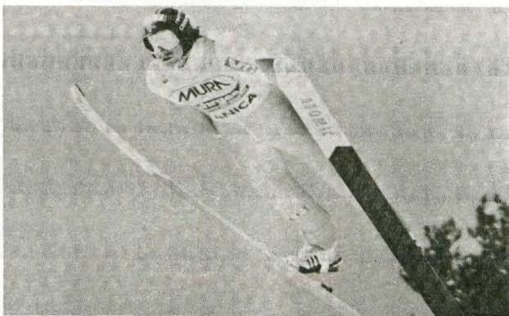
Takole je jadral Espen Bredesen novemu svetovnemu rekordu, 209 metrom naproti.