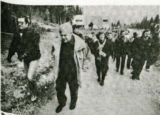
Predsednik republike Milan Kučan z ženo Štefko je bil v soboto med tistimi, ki so se povzpeli na vrh skakalnice.