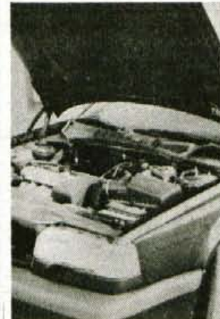
Motor: lep, kultiviran, delaven

polico oziroma žaluzijo in tako si radovedneži lahko po mili volji napasejo oči. Za prijetno ozračje skrbi klimatska naprava, ki ji je mogoče ukazovati tudi z ne preveč občutljivo avtomatiko, v testnem avtomobilu pa je bil tudi kakovosten radiokasetofon. In zanimivo, tisti, ki avtomobila ne poznajo, bodo zaman iskali radijsko anteno, ki je v zadnjem levem bočnem steklu.