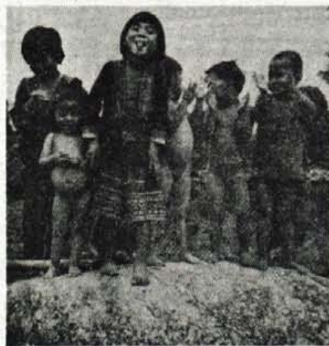
Otroci plemena Meo

Po enodnevnih pripravah smo odrinili. Kakih sto kilometrov smo se peljali z džipom, naprej peš. Opremljeni smo bili kot se spodobi in skoraj brez vsega. Dokumente in nahrbtnike smo pustili v sefu v Guest Housu. Že tako so na meji čudno gledali najina potna lista, kako bi ju šele potem, če bi bila nekajkrat namočena. S sabo smo nesli samo male vojaške nahrbtnike in čutare, ki nam jih je preskrbel vodič. Prvi dan smo hodili le nekaj uric, vmes smo se ustavili pri enem izmed slapov sredi džungle in se kopali. Prespali smo v vasi enega izmed gorskih plemen, ki živijo v tej džungli. Med hojo nas je enkrat vmes pošteno napralo, na Tajskem je trenutno deževna sezona. Prepričali smo se, da je res. Ko lije, pa res lije, kot se spodobi. Vodič Tong nam je skuhal odlično večerjo, po jedi pa smo se posedli okrog njega, pili kavo in čaj ter poslušali Tonga z odprtimi usti. Nekaj uric je minilo, kot bi trenil.