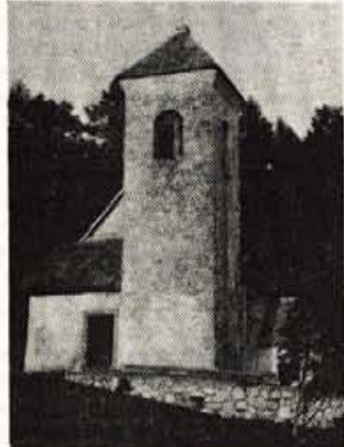
Po programu naj bi bila še letos končana prenova cerkvice na Ambrožu.