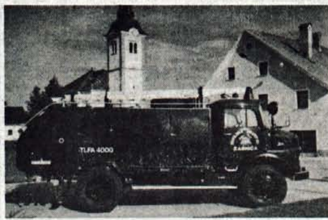
Poleg dveh orodnih vozil imajo zdaj gasilci v Žabnici tudi avtociстерno, ki jo bodo predstavili v nedeljo popoldne na prireditvi.

Žabnica, 12. avgusta - Med prizadenejšimi gasilskimi društvi v kranjski občini je vsekakor Gasilsko društvo Žabnica. Pred dvema letoma, ko so praznovali 85-letnico društva, so hkrati odprli tudi prenovljen gasilski dom. Takrat so z delom in prispevki krajanov ter ob pomoči širše skupnosti obnovili fasado s sliko sv. Florjana in uredili notranjost. V nedeljo pa bodo ponovno proslavljali. Tokrat bodo predstavili avtociстерno. Prireditve se bo začela ob 16. uri na Miklavževem vrtu v Zgornji Žabnici.