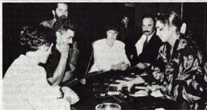
S prenovitvijo igralnice so povečali prostore, uredili hlajenje in izolirali prostore, uredili sistem video nadzora ter postavili nove mize in igralne avtomate. Z dokončanjem investicije bo v igralnici 22 igralnih miz in 80 igralnih avtomatov.

Turistično podjetje Casino Bled, katerega ustanovitelji so z 20-odstotnim deležem: Grand hotel Toplice Bled, G&P Hoteli Bled, Kompas Hotel Bled in IRP Alpinum Bohinj ter s 6,7-odstotnim deležem Hotel Lovce, Jelovica in Krim trenutno zaposluje okoli 70 delavcev, ker pa so že dlje časa ugotavljali, da so njihove propagandne akcije uspešne, in da bi v blejsko igralnico lahko privabili še več gostov, so se letos odločili za posodobitev. Z deli so začeli junija, končali pa so jih prejšnji teden. Kljub precejšnji razširitvi so poskrbeli, da v tem času ni bila igralnica zaprta niti en dan. Zavedali so se namreč, da je gosta težko pridobiti, prav tako težko pa je obiskovalce tudi zadržati: "Naka želja je, da dobimo goste, ki jim bomo lahko ponudili zabavo preko celega večera. To pa poleg obiska igralnice pomeni tudi obisk restavracije, kjer bodo zadovoljni za večerjo, in obisk zabavnega programa v