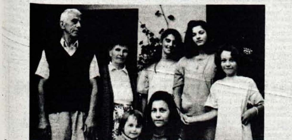
Pri Kananovićih v bloku Podmežaklo je sedem beguncev, od očeta, matere, nečakinj, kupaj z gostiteljema živijo na 41 kvadratnih metrih stanovanjske površine.

Kljub temu da jim je težko kot nikoli v življenju, pravijo, da se da preživeti tudi tako, da manjkatero stvar obrnejo na hecno stvar. In tako vsaj za trenutek pozabijo življenjske tragedije, ki so jih preživeli in premagajo strah in tesnobo, ki jim jo prinaša pomisel na jutrišnji dan... D.Sedej