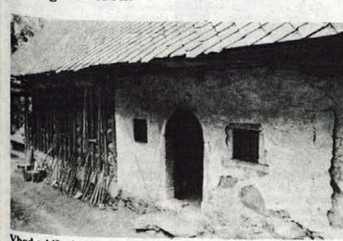
Vhod v hišo domačije Zavrh, ki se je zagotovo nekdanje lahko ponasala s svojim izgledom.

Škofja Loka, 12. avgusta - Manj kot deset kilometrov od Škofje Loke leži na koncu Bodovaljske grape v vasi Staniše domačija, po domače imenovana Zavrh, kjer prav do danes še ni električne napeljave. Na od daleč mogočni kmetiji se je pred več kot petdesetimi leti ustavil čas, jo hudo načel, hkrati pa ohranil kar precej tistega, česar še v muzejskih predstavvah ni mogoče videti.