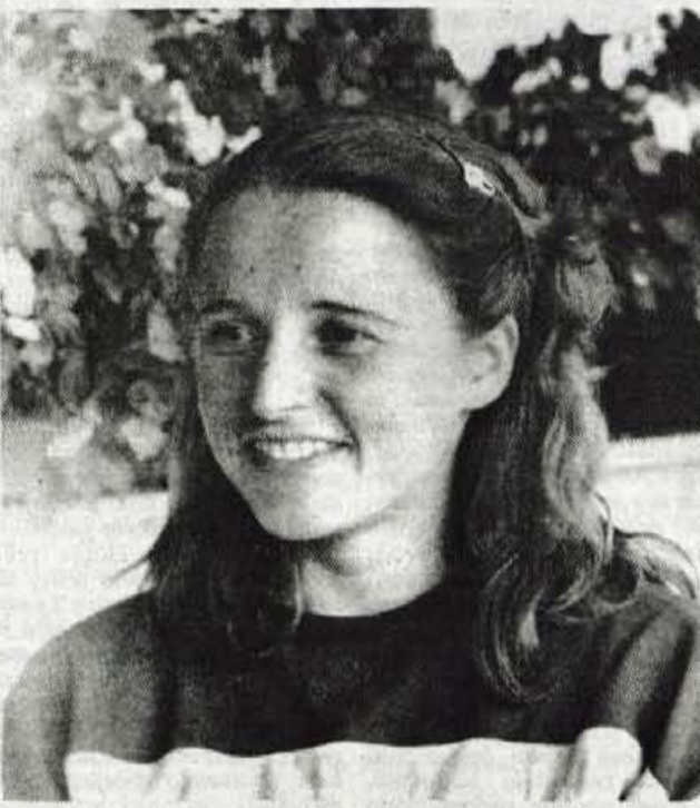
Grčić bi lahko ostala v Švici, povabili so jo na ETH, fakulteto v Zürichu. Pa se je vrnila nazaj. Ne za dolgo, ker je že kmalu nato odšla na študij francoskega jezika v Lyon. "Že vrsto let sem si želela, da bi se učila tega lepega jezika. Poleg tega je znanje svetovnih jezikov dobra naložba za življenje." Po treh mesecih intenzivnega študija jezika se je vrnila v Slovenijo in začela s pripravništvom v Verigi v Lescah. Vendar je le za četrto leta, potem je odšla nazaj v Francijo, spet za tri mesece, na ISP - Institut Francois du Petrole.

tako zlahka. Več ko veš, širša obzorja se ti odpirajo. Tu ne gre le za uspehe, ki ti jih priznajo drugi. Tudi uspeh v zasebnem življenju ti da motiv, elan. Po drugi strani pa ti tudi vsak dober rezultat da energijo za naprej. Mislim, da bom vse življenje potrebovala tako šport kot znanost. Šport mi daje energijo za življenje. Študij in stroka pa sta druga stran, povsem drugačna, ki pa me nič manj ne vleče. Vseč mi je igra možganov. Je že tako, da samo eno ali samo drugo pri meni ne gre, pa čeprav so to velikokrat zahtevali od mene. Celotno sva sem se spraševala, kaj naj izberem, pa nisem našla odgovora."