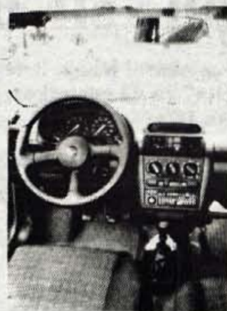
Športno zasnovan kokpit

Da ima ta majhen avto močan karakter, je jasno tudi znotraj: sodobno oblikovana armaturna plošča, pregledni merilniki in veliko opreme, predvsem pa konec oplovske dolgočasnosti. Našteto velja za različico Si, oziroma Sport, kakršna je bila tudi na naši preizkušnji. Napis sport na obeh bočnih vratih pomeni tudi športno oblikovan, malce previsok in prevelik, sicer pa odličen vs-