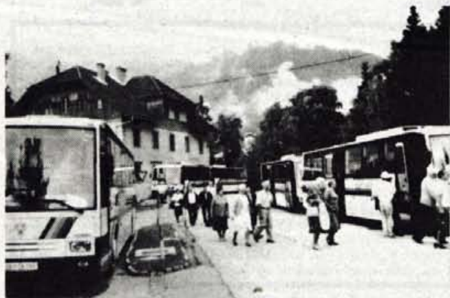
Ko smo se v soboto razšli v veselem razpoloženju, so bili vtisi o izletu enotni: "Nepozabna in enkratna izletniška rajža, na katero bi z veseljem še kdaj šli!"

Za prehrano in vse ostalo so na tokratnem Glasovem izletu poskrbeli: ŽIVILA KRANJ; PIVOVARNA UNION LJUBLJANA; MERCATOR - MESO IZDELKI ŠKOFJA LOKA; MEDIA ART KRANJ; INTEGRAL JESENICE; FOTO PRIM KRANJ.