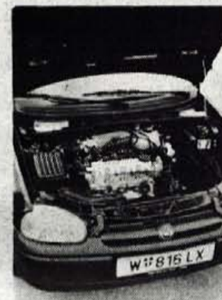
Polnokrven motor: 1388 ccm, 60 KW

pak močnejši s 60 kilovati. Zato tisti napis na vratih kar pristoji. Motor se rad zavrti vse do rdečega polja na merilniku vrtljajev, ki se začne pri številki 6500 in je ob petstopenjskem menjalniku s predolgo tretjo prestavo nasploh bolj naklonjen priganjanju v višje vrtiljaje.