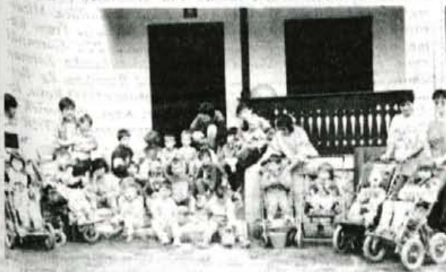
Gasilska slika za spomin na samostojne počitnice.

Kranj, 11. junija - Danes popoldne ob 15.30 Društvo za pomoč duševno prizadetim iz Kranja prireja srečanje ob zaključku šolskega leta. Kot vsa leta doslej, bo srečanje na dvorišču osnovne šole Helene Puhar. Ob tej priložnosti bodo sprejemali tudi članarino in prostovoljne prispevke za svoje delo.