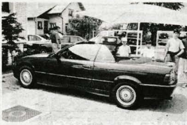
Vozili smo v Šenčurju: BMW 325i Cabrio

Med novostmi iz serije 3 so tudi prenovljeni model M3, prav tako narejen na osnovi kupeja. Na prvi pogled je novi M3 manj atraktiven kot predhodni model, toda poseben čar je testnemu avtomobilu dajala rumena barva, v notranjosti pa črna usnje. K športno prirejenemu podvozju sodi športen motor: 2990 kubični šestvaljnik z največjo močjo 210 kilovatov (286 KM), največji navor kar 320 Nm pri 3600 vrtljajih, pospešek od 0 do 100 kilometrov 6 sekund in najvišja hitrost 250 kilometrov na uro. BMW-jeva kvaliteta se v tem primeru kaže tudi v ceni: okoli 93.000 nemških mark z vsemi dajatvami