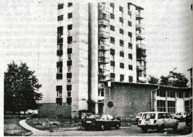
Po priključitvi Planine bodo zdaj med prvimi priključeni na plin v Sorlijevem naselju.

Za gradnjo v obeh fazah so pogodbe pripravljene oziroma zdaj tudi že podpisane. Po prvi pogodbi bo podjetje Petrol-zemeljski plin financiralo rekonstrukcijo strojne opreme v plinski postaji pri Ibiju v vrednosti 220 tisoč tolarjev in s 130 tisoč tolarji napeljavo plinovodnega omrežja. Druga pogodba pa