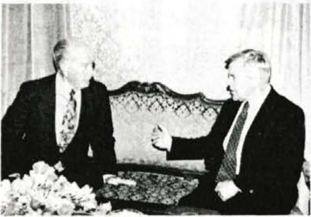
Guverner Marylanda Donald Schaefer pri predsedniku države Milanu Kučanu.

Guverner ameriške zvezne države Maryland William Donald Schaefer je bil prvi med predsedniki zveznih držav, ki so si tako po junijski vojni upali v Slovenijo. Tokratni obisk je tako drugi.