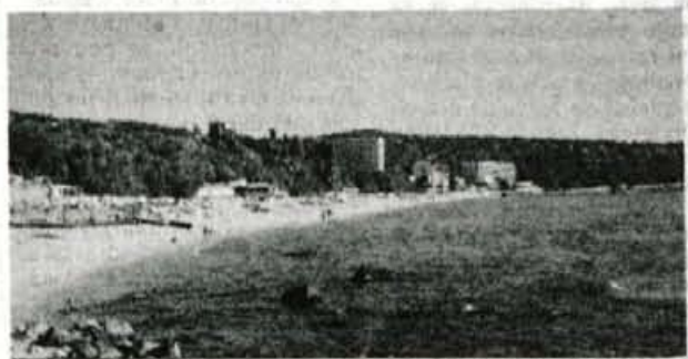
Idilčno letovišče Družba je najstarejše letovišče na bolgarski rivieri le streljaj od letovišča Zlatni piasaci.

Že kar precej let pred slovenskimi turisti so tisti iz zahodnoevropskih držav odkrili letovanje ob romunskih in bolgarskih črnomorskih plažah. Lani je v organizaciji zasebnega turističnega podjetja INTELEKTA iz Murske Sobote prvih 1500 slovenskih turistov spoznalo izredne naravne lepote v Romuniji: čudovite peščene plaže, odlično kulinariko, čisto in toplo morje. Med naravnimi lepotami je vsekakor v ospredju delta Donave, kamor prav do njenega osrčja vozijo izletnike s parniki, drugim se bo vtisnil v spomin obisk vinogradov in pokušina v svetu priznanih in z nagradami ovenčanih romunskih vin. Za vse, ki pa si dopust predstavljajo kot lenarjenje na neskončnih peščenih plažah, kopanje v toplim morju in ob kvalitetni kulinariki in hotelski postrežbi ter ceneni nakupih, sta letovišči Mamaia, na eni strani obdan z morjem, na drugi s sladkovodnim jezerom, ter tudi za zahodne turiste najbolj mondeno letovišče Neptun, najboljša izbira. Na te osmrednevne počitnice vozi vsak četrtek letalo z letališča Brnik in pristaja na letališču Constanta, od koder je do obeh letovišč le okoli pol ure vožnje.