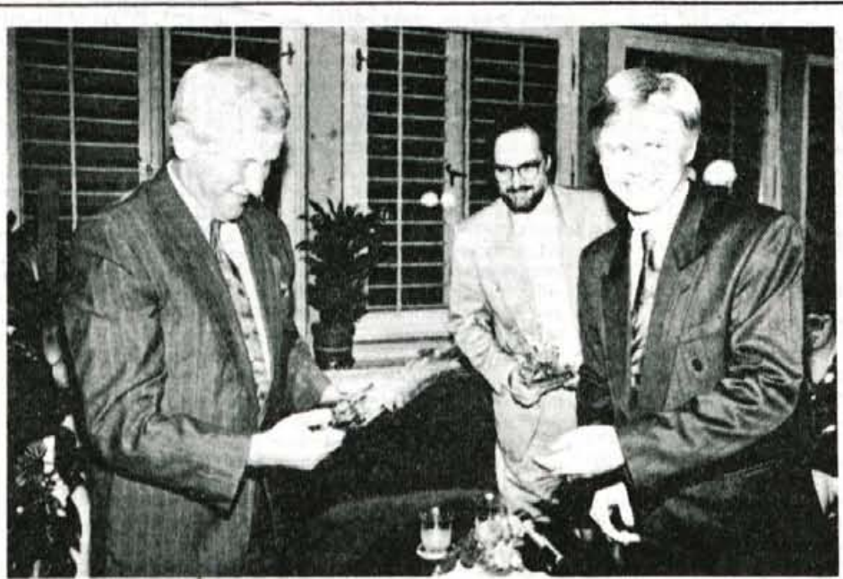
Z glasove preje