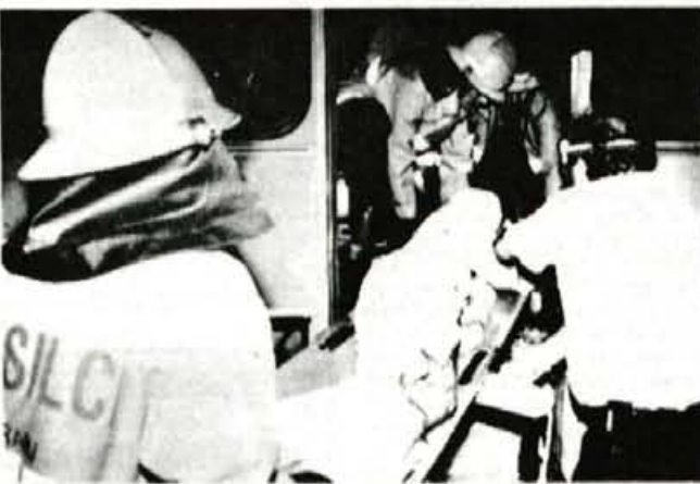
Namišljene ranjence so transportirali do triažnega mesta in naprej v mobilno bolnišnico.