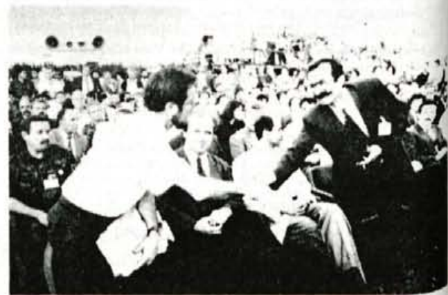
Med številnimi gledalci so bili tudi ugledni gostje.

dovoljstvo, da njegovi delavci znajo uporabiti vso sodobno reševalno opremo, nad katero so bili presenečeni tudi avstrijski in italijanski letalski pre-