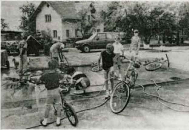
Dečki pri pranju svojih "jeklenih konjičkov", v avtopralnici Pelko.

bavno in hkrati poučno. Njihovi starši so se namreč dogovorili z ljudmi različnih poklicev, da so svoje vsakdanje delo predstavili malim zve-