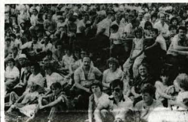
Številni obiskovalci tradicionalnega srečanja domačih ansamblov na Graški gori so željni narodnozabavnih zvokov...