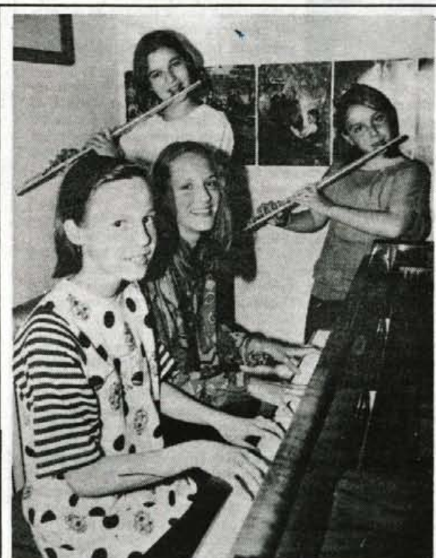
Uspešni mladi glasbeniki - Na letnem koncertu Glasbene šole Kranj se je predstavilo več kot trideset najboljših učencev. Med njimi tudi vseh deset, ki so se uspeli uvrstiti na letošnje državno tekmovanje mladih glasbenikov. Kranjska Glasbena šola je bila na tem nastopu zelo uspešna, saj sta flavtistki Saretova in Mladenovičeva osvojili vsaka v svoji kategoriji prvo mesto, klavirski duo Repovž-Trobec pa tretje mesto. Na prireditvi v sredo zvečer v dvoranci Glasbene šole so najboljšim s teh tekmovanj podelili priznanja in nagrade. L. M.

Plačilna kartica ACTIVA DENAR ZA AKTIVNE Ijubljanska banka Gorenjska banka d.d., Kranj