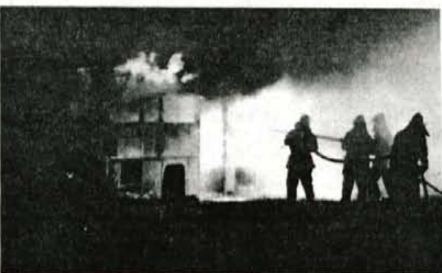
Letališki gasilci so v kratkem času ukrotili ogenj na razbitinah.