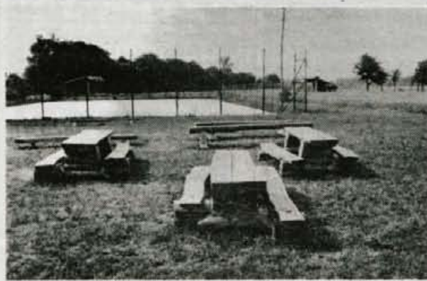
"Letna učilnica", ki so jo izdelali starši.

davčkom. Obiskali so frizerijo, trgovino, avtopralnico, avtomehanično delavnico, delavnico, kjer izdelujejo elektromotorčke, pizzerijo, deklice so svojim Barbikam izdelale oblačila, ogledali pa so si tudi jadralno padalo in letalo.