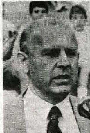
Slavnostni govornik Janez Kocijančič