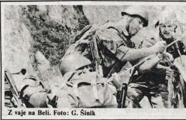
Z vaje na Bledi.