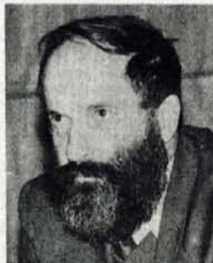
Vitomir Gros, kranjski župan

Prav pri zdravstvenem tehniku je zaenkrat zaposlovanje lažje kot pri večini drugih poklicev, k čemur deloma prispevajo tudi zaposlitvene možnosti v sosednjih državah, zlasti Avstriji in Italiji.