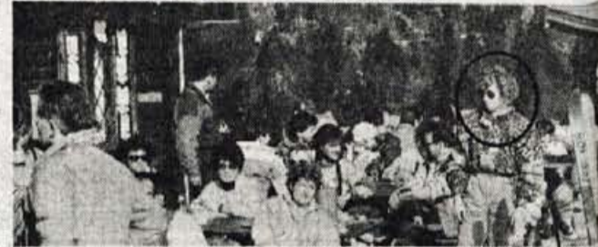
Po smuki se počitek prav prileže... Če ste se v okvirčku spoznali, nam sporočite kraj in čas, ko vas je posnel naš fotoreporter. Čaka vas lepa praktična nagrada...