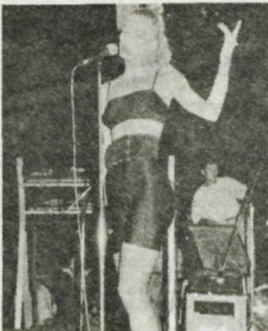
Skupina Spekter, ki je nastopila namesto Adrie dixielanda, je občinstvo pritegnila predvsem s svojo prikupno pevko.