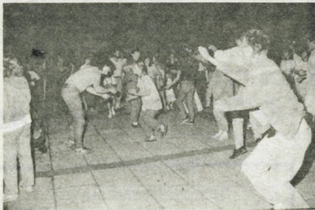
Skupina California je do zgodnjih jutranjih ur ogrevala predvsem mladino.