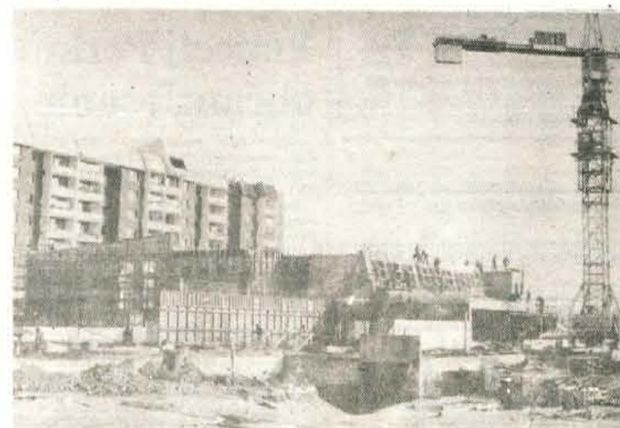
Nova šola na Planini — Julija je SGP Gradbincev začel graditi novo osnovno šolo na Planini II. V njej bo v 25 učilnicah prostora za 725 otrok. Zgrajena bo pred doma maja 1988. leta. Doslej gre gradnja, ki je razdeljena v tri dele, po načrtih oziroma celo nekaj prehitveva. Zdaj gradijo osrednji trakt, januarja bodo začeli trakt za predmetni pouk, maja pa še tretji del. Za tak način so se odločili, da bi denar, ki ga združujejo kranjski delavci in se sproti ne reka, čim manj izgubljal.

Preostalih 4,5 milijarde dinarjev pa naj bi zagotovili z 0,6-odstotno iz kosmatih osebnih dohodkov delavcev v prvem polletju prihodnjega leta.