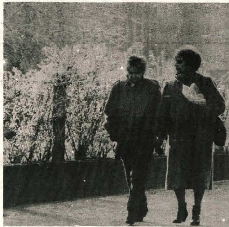
Dnevi so topli, sončni po dolinah in megleno zatohtli po kotlinah, zato se kar prileže prijeten sprend med ivjem, ki naznanja počasi prihajajočo zimo.