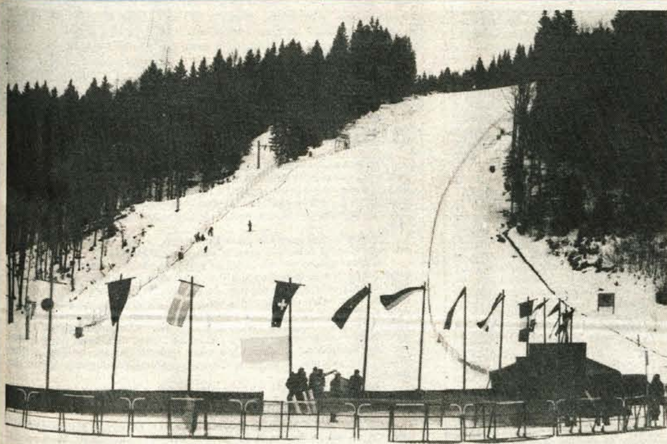
KRANJSKA GORA — Kranjska gora je pripravljena na petindvajseti mednarodni FIS pokal Vitranc. Nad devdeset smučarjev iz Evrope in Amerike bo danes v svetovnem moškem pokalu merilo moči v veleslalomu, jutri v slalomu. Danes bo na smučišču Podkorena ob 10. uri start veleslaloma, jutri ob 10. uri pa bo start slaloma. (-h)

GLASILO SOCIALISTIČNE ZVEZE DELOVNEGA LJUDSTVA ZA GORENJSKO