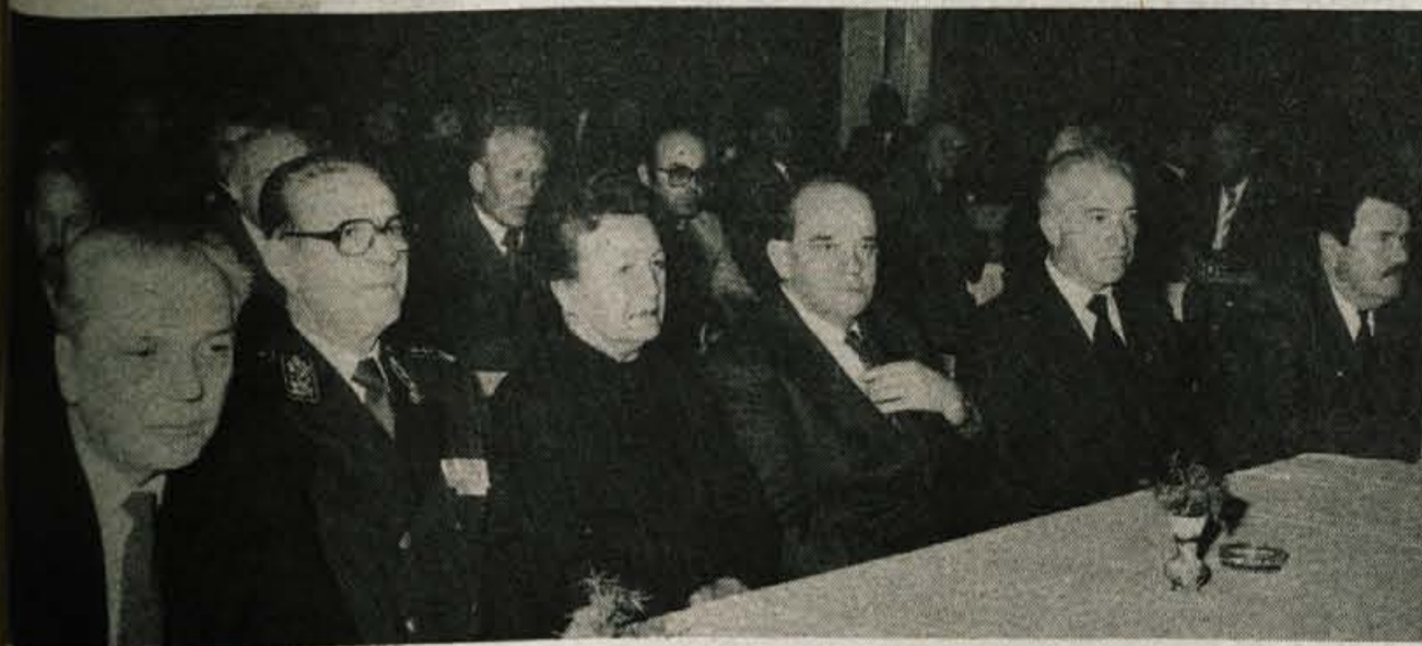
Srečanje v Iskri so se udeležili tudi številni gostje