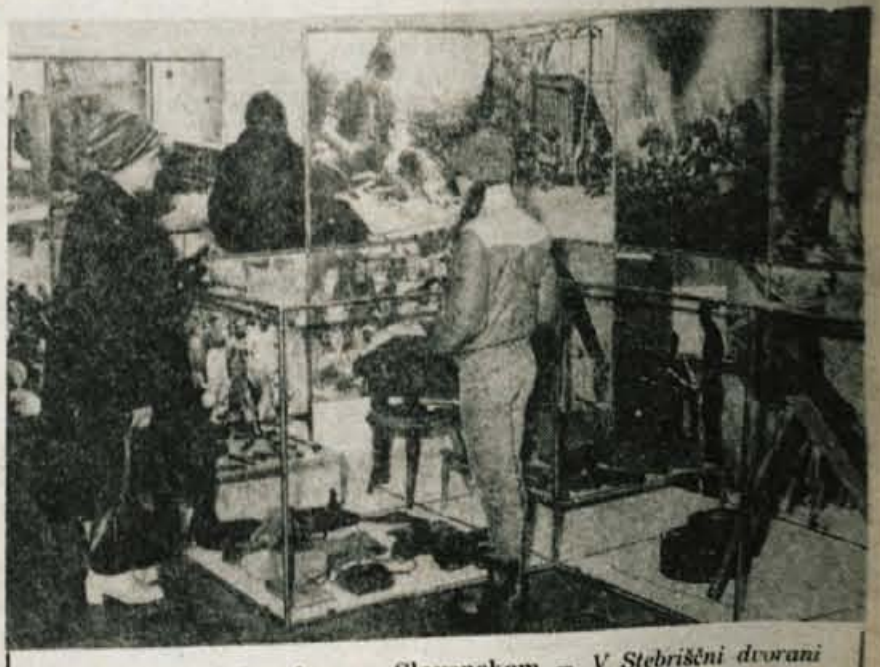
Partizanske delavnice na Slovenskem — V Stebrišni dvorani Mestne hiše v Kranju so ob dnevu JLA odprli dokumentarno razstavo »Partizanske delavnice na Slovenskem«, ki jo je Gorenjski muzej pripravil s sodelovanjem Muzeja ljudske revolucije Slovenije.