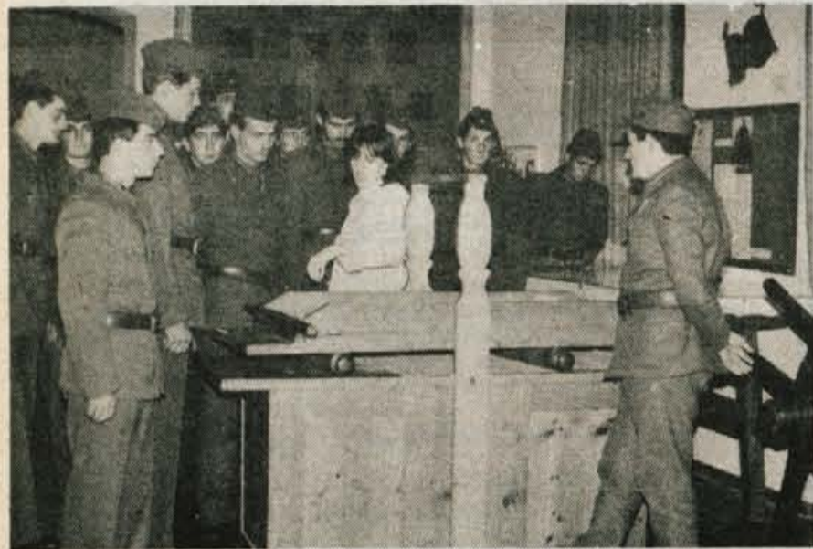
Vojaki si z zanimanjem ogledujejo predmete v škofjeloškem muzeju

Pripadnike armade v škofjeloški vojašnici od prihoda vanjo seznanjajo z okoljem — Za mlade vojake pripravljajo redne ogled predavanj z diapozitivi in muzeja — Sodelovanje s prebivalstvom na mnogih področjih